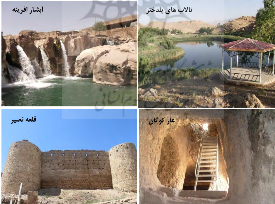
شکل ۲. جاذبه‌های شاخص گردشگری در روستاهای واقع در حریم محورهای ارتباطی مورد مطالعه و محیط اطراف آنها.