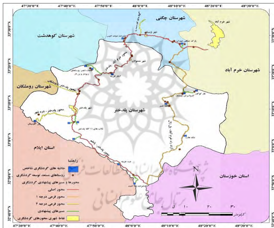
شکل ۳. اولویت‌بندی محورها و مسیرهای پیشنهادی گردشگری در محدوده مورد مطالعه.

شهرستان پلدختر می‌شود. محور خرم زال به عنوان محور فرعی درجه ۱، از محدوده شهرستان خرم‌آباد، چگنی و پلدختر عبور می‌نماید، اما بخش عمده آن در شهرستان پلدختر واقع شده است. محورهای فرعی درجه ۲ متصل به محور خرم‌آباد - پلدختر شامل مسیر فرعی چم دیوان - سراب دوره، پلدختر - رومشکان و پلدختر - دره شهر می‌باشند. از مسیرهای پیشنهادی دارای پتانسیل گردشگری در محور اصلی خرم‌آباد - پلدختر می‌توان به محورهای منتهی به پارک جنگلی شوراب (روستای شوراب گردنه)، امامزاده حیات الغیب (روستای حیات‌الغیب)، روستاهای