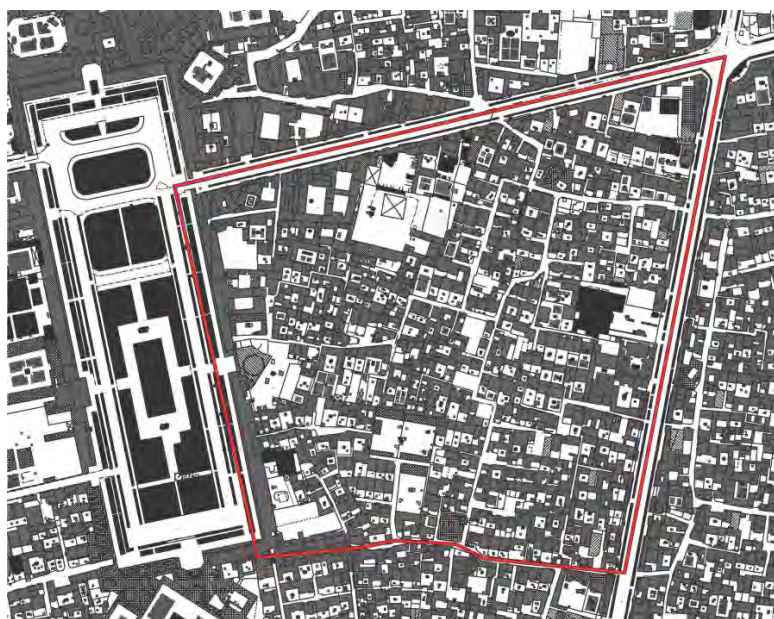
تصویر ۱: محدوده محله پشت گنبد