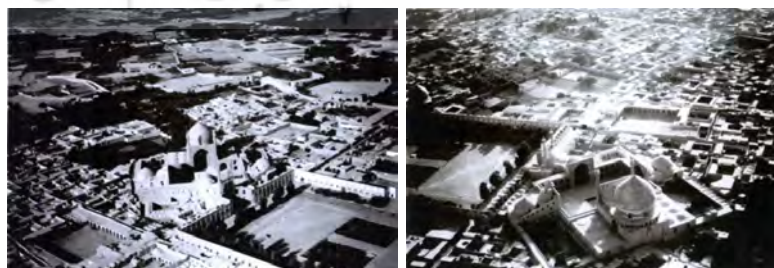
تصویر ۲ و ۳: عکس هوایی سال ۱۹۳۷ از محدوده مورد مطالعه (اریک ف، ۱۳۷۶)

میدان نقش جهان به عنوان هسته مرکزی شهر اصفهان (از عصر صفوی به بعد) مرکز تبادل کالا و افکار در شهر، دارای عملکرد فرا شهری بوده است. گذرهای منتهی به آن به فراخور طول خود و یا امکان ارتباط با دیگر نقاط عمده شهری واجد ارزش‌های متفاوتی بوده‌اند. چنانچه پیش از این آمد محورهای با ارزش محدوده شامل محور بازار به عنوان مهم‌ترین محور است که ضرورت تداوم آن به سمت شمال، با توجه به اهمیت تداوم حرکت پیاده در بافت و تأثیر آن در ماندگاری بیشتر گردشگر و استفاده از ویژگی‌های ناشی از مجاورت این محور با ابنیه شاخص و با ارزش تاریخی احساس می‌شود. از آنجایی که این محور بخشی از ساختار اصلی شهر و آن هم به عنوان پیوند دهنده در مرکز ساختار، تشکیل می‌دهد، می‌توان گفت که در صورت احیای عناصر مجاور آن و اتصال کالبدی آن با بافت شمالی زمینه استفاده بیشتر از عناصر تاریخی که از محورهای درجه دوم به بازار متصل می‌شوند نیز از منظر گردشگری بیشتر می‌گردد که خود می‌تواند سوای اثرات فرهنگی و اجتماعی، ارتقاء وضعیت اقتصادی را در داشته باشد.