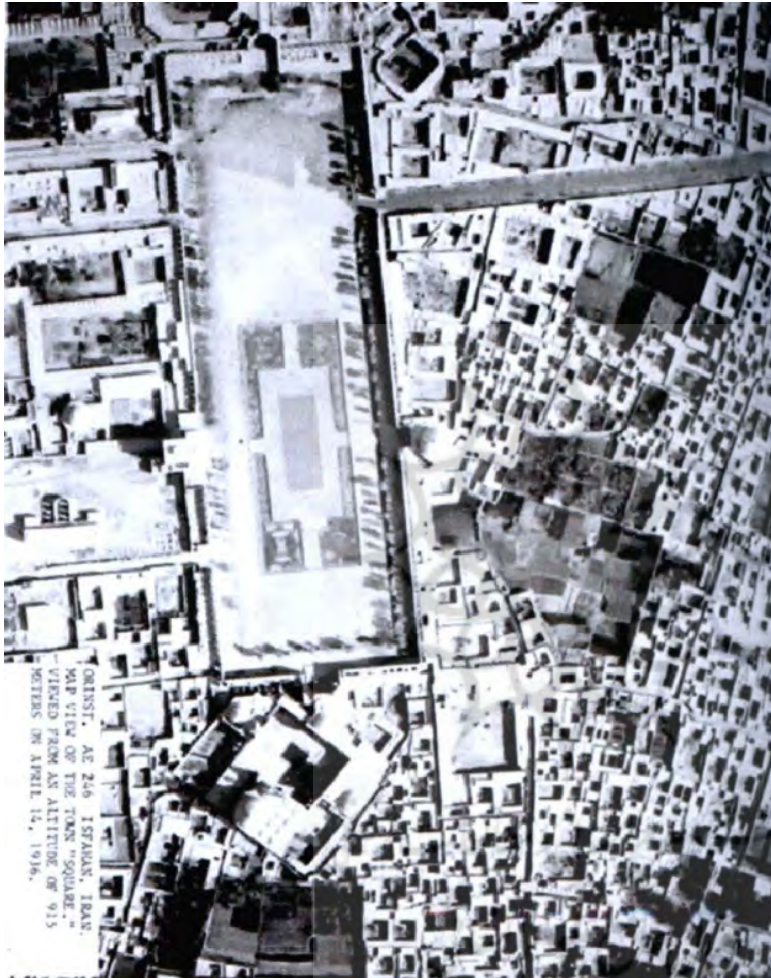
تصویر ۴: شرق و جنوب مسجد جایی که بدنه‌ها به بازار متصل می‌شود نیز در عکس‌های اشمیت مشهود است. (اریک ف، ۱۳۷۶)

احیای نقش مراکز مذهبی در طرح‌های مرمت بافت‌های تاریخی شهری مبتنی بر ملاحظات فرهنگی؛ مورد مطالعه: بافت تاریخی محله پشت گنبد اصفهان میلاد فتحی، محمد مهدی زینوف صص ۲۹-۴۸