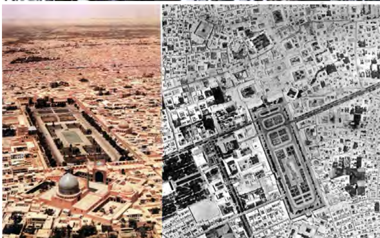
تصویر ۵: عکس هوایی سال ۱۳۵۵ و دید به محدوده جنوب و شرق میدان سال ۱۳۸۰