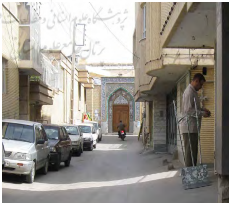
تصویر ۸: قرارگیری در نقاط شاخص از مسیر جهت خوانایی و وضوح بیشتر (نگارندگان، ۱۳۹۰)

در حال حاضر با توجه به تراکم و ساختار بافت محله احداث کاربری مذهبی برخلاف گذشته با مشکلات بسیاری مواجه است. دیگر زمین‌های باز و نامحدود و مناسب برای هرگونه ساخت و سازی وجود ندارد در حالی که محل قرارگیری مساجد و مراکز مذهبی بسیار حائز اهمیت می‌باشد. قرارگیری این مراکز در مسیرهای مناسب و سهولت در دستیابی به آن و نیز امکانات کافی در کنار این مراکز مانند محل پارک خودرو و... همگی عواملی است امکان استفاده از فضا را تسهیل کرده و باعث رونق و تأثیرگذاری این مراکز خواهد شد. فاصله مناسب این مراکز تا منازل مسکونی و تأمین سرانه‌های مناسب (شعاع عملکرد مناسب) از دیگر موارد مهم در انتخاب محل احداث این مراکز می‌باشد. همانطور که پیشتر نیز اشاره شد با کمبود سرانه مراکز فرهنگی، ورزشی و مذهبی و... در محله پشت گنبد مواجه هستیم، احداث مراکز جدید با جانمایی مناسب و ترمیم و مرمت بناهای مراکز موجود و نیز افزایش فضاهای اطراف آن‌ها در جهت افزایش امکانات و تسهیل در دسترسی و استفاده از آن می‌تواند موجب رونق و منشأ تأثیر در احیا و ارتقاء کیفیت محله گردد.