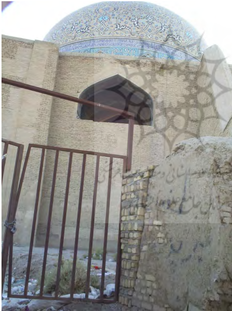
تصویر ۷: فضاهای رها شده پشت گنبد شیخ لطف‌الله و در کنار سایر مراکز مذهبی دیگر (نگارندگان، ۱۳۹۰)

۸-۲-۳- افزودن فضای باز و نیمه‌باز و نیز افزایش سرانه‌های مراکز مذهبی یکی از مشکلات مراکز مذهبی موجود در بافت تاریخی محله پشت گنبد آن است که این مراکز عمدتاً محصور، مسقف و دارای مقیاس‌های کوچک می‌باشند. وجود زمین‌های بایر، بناهای قدیمی فاقد ارزش، متروکه و مخروبه در کنار مراکز مذهبی و یا بافاصله‌های بسیار کم از آن‌ها از یک سو و کم بودن سرانه‌های فضای سبز، فضاهای فرهنگی و ورزشی محله از سوی دیگر این فرصت را فراهم می‌آورد که با طراحی مناسب و روزآمد این بخش‌ها همراه با پوشش گیاهی مناسب و نورپردازی کافی (هر دو مورد از نیازهای محله می‌باشند) و اتصال آن به مراکز مذهبی و قراردادن مالکیت این فضا در اختیار این مراکز می‌توان علاوه بر ایجاد فضاهایی امن، ایمن جهت حضور و تجمع شهروندان و ساکنین موجب رونق هرچه بیشتر مراکز مذهبی گردید. در واقع علاوه بر استفاده مناسب از این فضاها در راستای رفع نیازهای محله، می‌توان با افزایش فضای این مراکز امکان فعالیت بیشتر و مناسب‌تری را به وجود آورد. فعالیت‌هایی که بروز آن در فضاهای عمومی و باز بر شکوه و تأثیر آن بیافزاید.