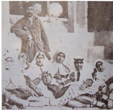
تصویر ۳ - ناصرالدین شاه با چند تن از زنانش در جاجروود، عکس از ناصرالدین شاه، ۱۲۸۶ ق.م (تاریخ عکاسی و عکاسان پیشگام در ایران)