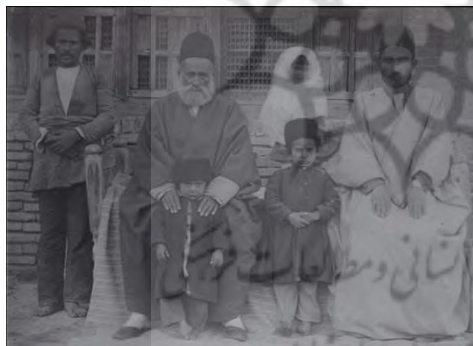
تصویر ۵ از مجموعه رکنی (سایت تاریخ عکس زنان قاجار)

در دو تصویر (۴ و ۵) می‌بینیم که چگونه «دیگری» (از طبقه‌ای فرودست) در عکس خانوادگی بازنمایی شده است. در یکی دیگری که از نوع پوشش، ژست و البته جایی که در کادر (گوشه) و همچنین فاصله‌ای که با خانواده رکنی دارد، تشخیص اینکه او از این خانواده و حتی هم‌شأن کودکان درون عکس نیست؛ به آسانی قابل تمیز است. در عکس مریم دختر علی خان حاکم، پرستار یا خدمتکار به‌عنوان «دیگری» در حد شیء نزول کرده است و تنها به‌عنوان ابزاری جهت نگهداری و بازنمایی ایده‌آل دختر حاکم نشان داده شده است. غیاب برخی طبقات در عکس با اجباری شدن سجل (شناسنامه) ۱ ، آسان و ارزان شدن فرایند عکاسی و کار با دوربین، رواج عکاسخانه‌های عمومی در تهران و شهرستان و در واقع در تغییر کارکردهای اجتماعی عکس در جامعه ایرانی در دوران پهلوی اول کمی کاسته و در دوره پهلوی دوم این روند ادامه یافت.