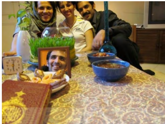
تصویر ۸- حضور عکاس در عکس ۱۳۸۸

در تصویر (۸) می‌بینیم که چگونه عکاس سعی نموده است تا با قراردادن تصویر خویش در آینه، بر غیاب خود در عکس خانوادگی چیره شود.