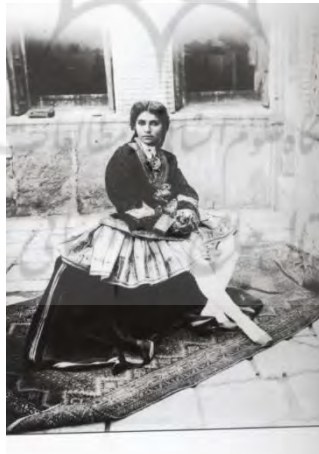
تصویر ۲- زن ایرانی، اواخر قاجار، عکس آنتوان سوریوگین (ایران از نگاه سوریوگین)

«سوریوگین اولین عکاسی بود که عکس زن ایرانی را در اختیار خواستاران آن در خارج از کشور قرار داد. او عکس‌های بسیار زیادی از زنان در طول دوره کاری‌اش گرفته است، در حالی که تعداد زیادی حالت مستند از زندگی روزمره آنان دارد، تعداد قابل توجهی نیز تصاویری مخدوش از واقعیات مربوط به آنان را ارائه کرده است. اکثر زنان در چنین عکس‌هایی به احتمال قوی مستند بودند که در مقابل دریافت وجهی، مدل او شده‌اند. این عکس‌ها زننده و یا پورنوگرافیک (به معنای امروزی) نیستند و تنها برانگیزنده تخیلات مردان زمانه بوده‌اند» (شیخ، ۱۳۷۸: ۵).