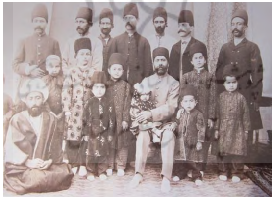
تصویر ۱- میرزا نظام خان مهندس الممالک غفاری با خانواده و پیرامونیان، دهه ۱۳۱۰ ه. ق (تاریخ عکاسی و عکاسان پیشگام در ایران)

در عکس‌های خانوادگی قاجار تصویر زن (در نقش مادر و یا همسر) غایب است؛ اما این غیاب خود را از طریق برخی نشانه‌های حاضر در متن عکاسی نشان می‌دهد. نشانه‌هایی چون تصویر دخترچه‌های کوچک و زیبا در کنار پدر یا برادر با ظاهری آراسته و زنانه که جای مادر و همسر را در عکس اشغال کرده‌اند و یا به‌گونه‌ای حضور زن را تداعی می‌کنند. همان‌گونه که امروزه در برخی از نمونه‌های تبلیغات در روزنامه‌ها، آگهی‌های ترحیم زنان و غیره در کشور تصویر گل، کودک و حتی مرد جانشین تصویر زن می‌شود.