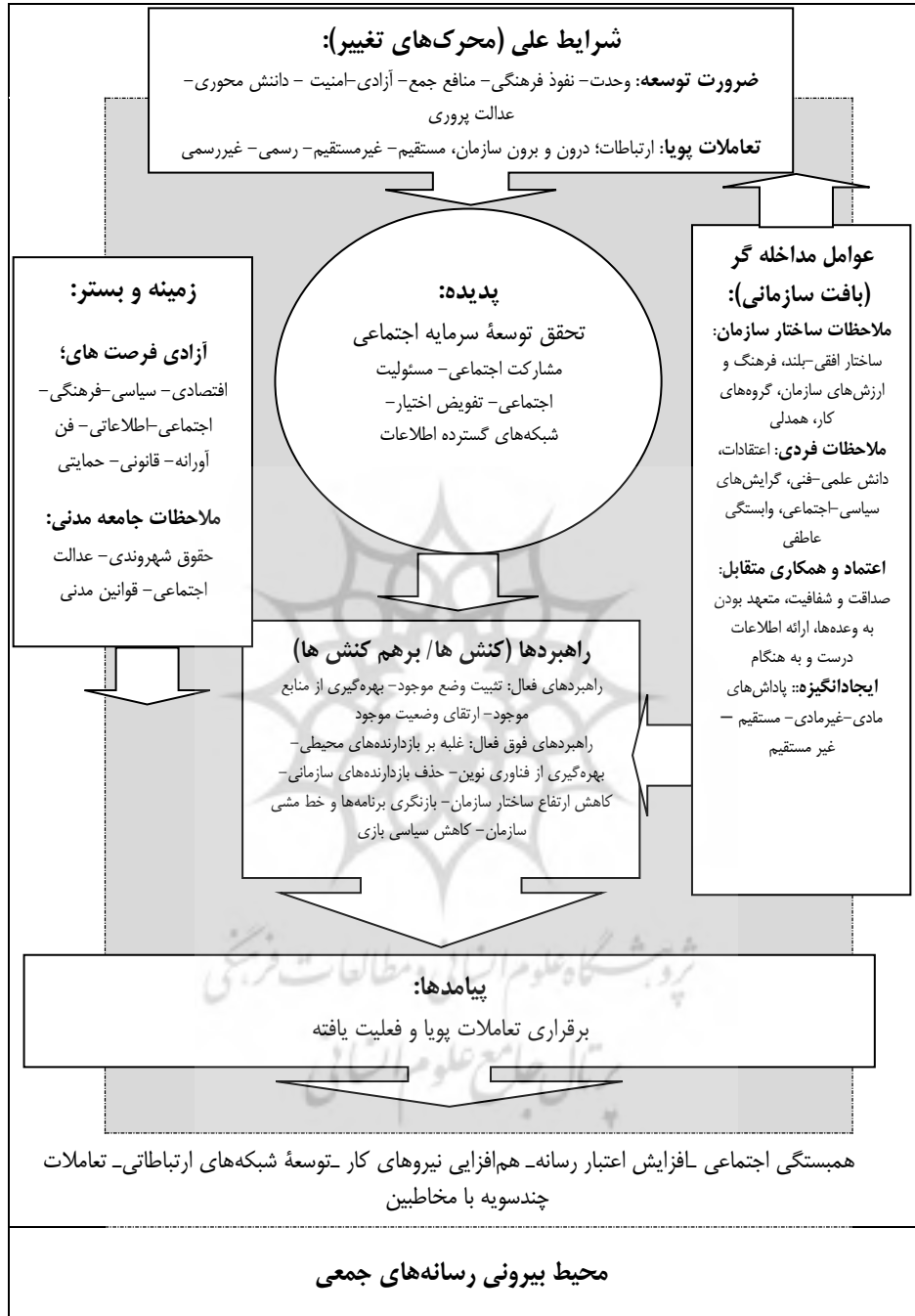
شکل شماره ۳: الگوی کارکردی صدای جمهوری اسلامی ایران با تأکید بر توسعه سرمایه اجتماعی