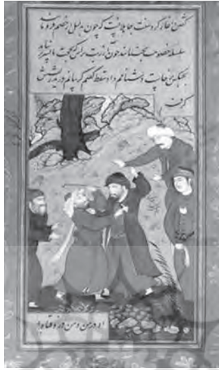
تصویر ۱. «جدال سعدی با مدعی» اثر رضا عباسی، بر اساس حکایتی از گلستان سعدی (محمی الدین و همکاران، ۱۳۹۳)

و در نهایت بر آن می‌شوند تا حل این مجادله یا به عبارتی مخاصمه را نزد قاضی ببرند و به حکومت «عدل» راضی شوند تا حاکم مسلمان مصلحتی بجوید و میان توانگران و درویشان فرقی بگوید. قاضی نیز پس از شنیدن سخنان و دلایل هر دو طرف، سر بر جیب تفکر فرو می‌برد و تأمل بسیاری می‌کند و در یک جمله پاسخ هر دو را می‌دهد: «هر جا گل است خار است»؛ یعنی بد و خوب در هر لباسی وجود دارد.