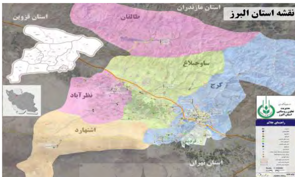
شکل شماره (۱): نقشه محدوده مورد مطالعه