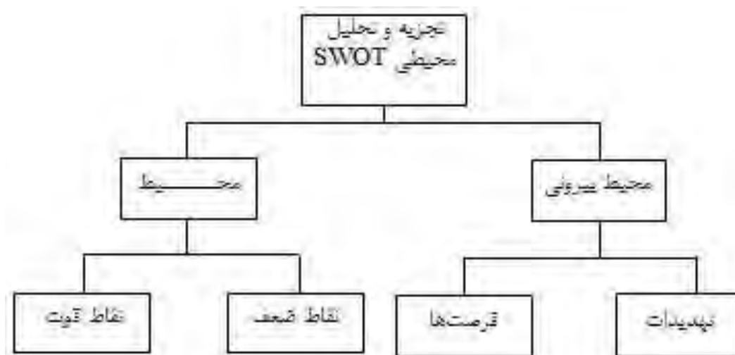
شکل شماره ۱: شمای کلی از مدل swot