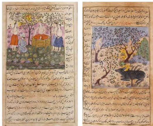
تصاویر ۱۰ و ۱۱. ملکه جزیره واقواق و درخت واق. عجایب المخلوقات قزوینی. آبرنگ مات، طلا، جوهر سیاه و قرمز به روی کاغذ. 24 × 34 Cm. هند. ۱۲۳۸ هجری (۱۸ م).