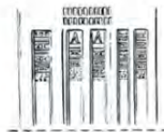
ت: شوش Amiet, 1972: PI 18. 693