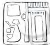
ج: شوش Amiet, 1980: 279, PI 16. 271