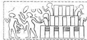
الف: چغامیش Kantor & Delugaz, 1996: PI 151c