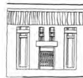
پ: چغامیش Kantor & Delugaz, 1996: PI 154c