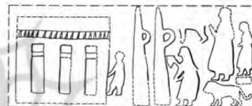
ث: چغامیش Kantor & Delugaz, 1996: PI 154a