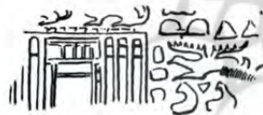
ح: شوش Amiet, 1972: PI 18. 692a