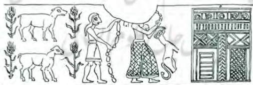
خ: معبد آنا Amiet, 1980: 339, PI 44. 642