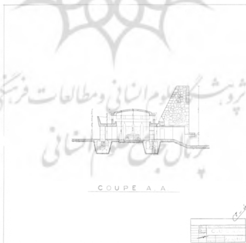
تصویر ۲. نما و مقطع آرامگاه نادر، ترسیم هوشنگ سیحون.

در نمای اصلی فاصل بین مجسمه و موزه کوچک، مجموعه بنا طوری ساخته شده که به‌خصوص در نمای اصلی برجستگی نباشد. یعنی ابزارکاری‌ها و تراش سنگ‌ها تماماً از داخل باشد و این به منظور ایجاد قدرت تجسمی و تصویری بیشتر است. فقط در قسمت موزه کوچک ۳ ناودان عظیم سنگی از متنبرون آورده‌اند که بیشتر جنبه زیبایی دارند (همان: ۴۹-۵۰).