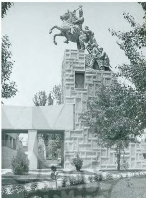
تصویر ۵: کروپ مجسمه نادرشاه.