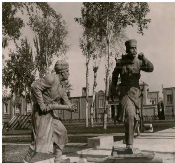
تصویر ۴: سربازان شیپورزن و تفنگدار مجسمه نادرشاه.