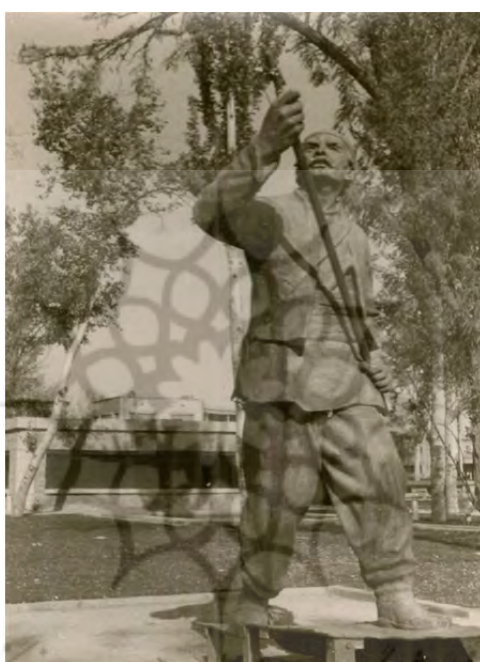
تصویر ۳: سرباز پرچم‌دار مجسمه نادرشاه.

در کار، پذیرفت علاوه بر مبلغ یک میلیون ریالی که قبلاً متعهد به پرداخت به وی شده بود، مبلغ یکصد و بیست هزار ریال دیگر هم در مقابل ساخت ماکت گچی مجسمه، اقامت در ایتالیا و نظارت بر مراحل ساخت و نصب مجسمه اصلی به او پردازد. اما افزایش مبلغ قرارداد کارخانه برونی را غیرمنطقی و غیرعملی دانست و تهدید کرد در صورت اصرار کارخانه بر مبلغ پیشنهادی خود و روشن نبودن تعهدات آن، کار را به کارخانه دیگری واگذار خواهد کرد (همان، اسناد ساماندهی نشده/۱۳۹۸-۱۰).