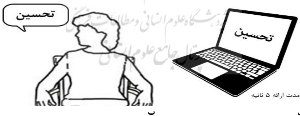
شکل ۱ مراحل رمزگردانی و بازیابی تکلیف.

نرم افزار Dmdx: کلمات انتخابی از هنجار هیجانی کلمات فارسی به صورتی تصادفی توسط نرم افزار Dmdx (فارستر و فارستر، ۲۰۰۳) (بر روی لپتاپ لنوو، مدل G510، صفحه‌نمایش ۱۵/۶ اینچ) به شرکت کنندگان ارائه شدند. هر کلمه به مدت ۵ ثانیه ارائه شد و فاصله بین محرک‌ها نیز ۰/۵ ثانیه بود. در مرحله بعد، به شرکت کنندگان آموزش داده شد تا حرکت افقی سر را با سرعتی متناسب (سه ثانیه یک‌بار با شنیدن صدای مترونوم نصب شده روی گوشی موبایل)