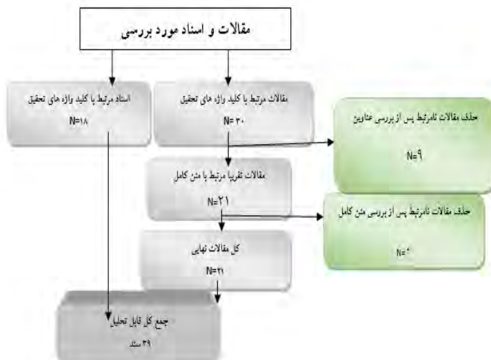
شکل ۱: مراحل گزینش، پالایش و سازماندهی مطالعات