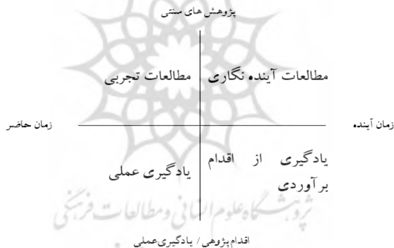
شکل ۲. موقعیت فکری یادگیری از اقدام برآوردی (مارکلی، ۲۰۱۱)

از اقدام و آینده‌پژوهی ارائه کرده است. از دیدگاه عنایت‌الله (۲۰۰۴) یادگیری از اقدام برآوردی دارای مشخصات ذیل می‌باشد: هدف خلق بدیل از طریق پرسش از آینده است. عین و ذهن هر دو واقعیت دارند مهمترین نکته، تعامل بین معانی و اقدامات می‌باشد آینده ثابت نبوده و باید به‌طور مداوم مرور شود یادگیری مبتنی بر دانش برنامه ریزی شده و پرسش از آینده و روش‌های شناخت و کسب اطلاع است یادگیری ناشی از اقدام، از طریق تجربه کردن می‌باشد مشارکت همه افراد و پرسش از مشارکت کنندگان پیرامون چگونگی مشاهده آینده تعریف آینده به‌صورت متقابل.