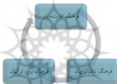
نگاره ۱. تبارشناسی فرهنگ دانشگاهی (ذکر صالحی، ۱۳۹۷)

ذکر صالحی (۱۳۹۷) بر این باور است که فرهنگ دانشگاهی پیوند مستحکمی با ایده دانشگاه دارد. از این رو، اگر بخواهیم تبارشناسی ساده‌ای از فرهنگ دانشگاهی ترسیم کنیم، باید به‌طور معمول سه فرهنگ اندیشه‌ورز، تکنولوژیک و بوروکراتیک را در ادبیات شناسایی کرد. در نگاره ۱ تبارشناسی فرهنگ دانشگاهی بیان شده است.