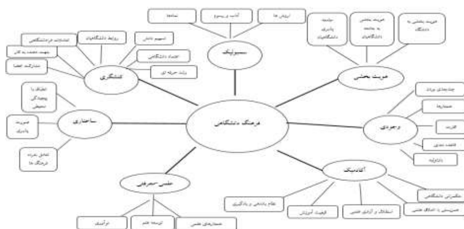
نگاره ۴. مدل شبکه مضامین برآمده از یافته‌های پژوهش