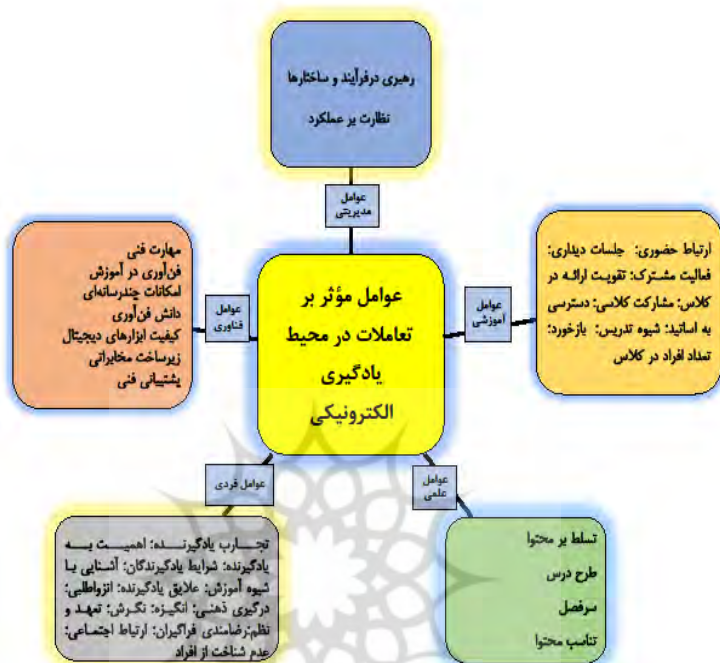
شکل ۳. عوامل مؤثر بر تعاملات در محیط یادگیری الکترونیکی