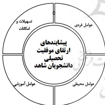
تصویر ۱. چارچوب نظری پژوهش

نگارنده براساس مطالعه پیشینه تحقیق، اهداف و سوال ها، چهارچوب نظری پژوهش را تدوین کرده که شامل چهار بعد اصلی است. بر این اساس تلاش می شود عوامل موثر بر پیشرفت تحصیلی دانشجویان شاهد در این چهار زمینه شناسایی، طبقه بندی و اعتبارسنجی شوند (تصویر ۱).