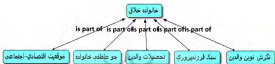
شکل ۳. بعد خانواده خلاق مبتنی بر نرم‌افزار اطلس

بعد خانواده خلاق و ارتباط آن با مؤلفه‌هایش که از تحلیل کیفی داده‌ها با استفاده از نرم‌افزار اطلس استخراج شد (شکل ۳).