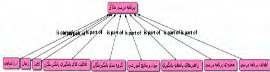
شکل ۱. بعد برنامه درسی خلاق مبتنی بر نرم افزار اطلس

یکی دیگر از ابعاد تشکیل دهنده مدرسه خلاق، دانش آموز خلاق بود. این بعد از سه مؤلفه تشکیل شده است: ۱. باورشناختی-فکری؛ ۲. نگرشی-علاقه ای؛ ۳. رفتاری-عملکردی (جدول ۲).