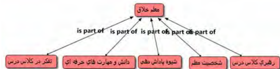
شکل ۴. بعد معلم خلاق، مبتنی بر نرم‌افزار اطلس

بعد معلم خلاق و ارتباط آن با مؤلفه‌هایش که از تحلیل کیفی داده‌ها با استفاده از نرم‌افزار اطلس استخراج شد (شکل ۴).