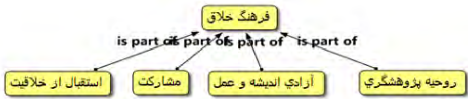
شکل ۶. بعد فرهنگ خلاق، مبتنی بر نرم‌افزار اطلس