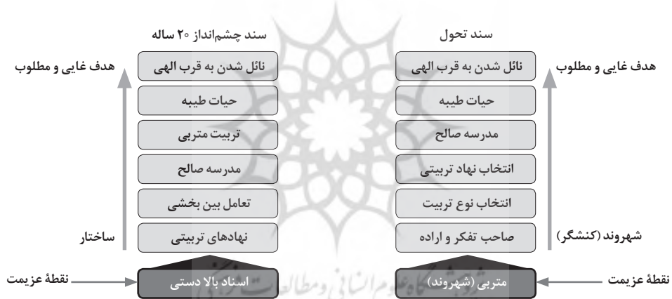
نمودار ۱. مسیر تربیت شهروندی مطلوب در سند تحول و سند چشم‌انداز

بر مبنای یافته‌های پژوهش، رویکرد جمهوری اسلامی در تربیت دانش‌آموزان به‌عنوان شهروند، با تحلیل محتوای کیفی اسناد مربوطه و کاهش و کدگذاری مباحث در فرایند مقوله‌سازی و زیرمقوله‌های آن، نگرش سیاست رسمی به اجتماعی کردن دانش‌آموزان، نوعی شهروند دینی - اجتماعی مفهوم‌سازی شد. اما برای رسیدن به این مطلوب، هر کدام از اسناد مسیر متفاوتی را برای رسیدن به هدف غایی مشترک که همانا قرب الهی است، طراحی می‌کنند؛ اگرچه هر کدام به مسیر با نقطه شروع متمایز برای تربیت شهروندی توجه دارند: سند تحول و مبانی نظری آن در بطن مفهومی خود رویکرد فردمحوری دارد، نهادهای مرتبط، حیات طیبه، و مدرسه صالح را برای تربیت لازم می‌داند، و سند چشم‌انداز که تا حدود زیادی نهاد محور است، دولت و نظام رسمی را مبنای شروع تربیت این سوژه می‌داند، اما به این نکته اشاره می‌کند که چنین شهروندی در نهایت باید خودارزیاب، منتقد، مشارکتی و... از دل این نهادها و ساختار خارج شود. مسیر تربیت شهروندی در نمودار ۱ بهتر نمایان است.