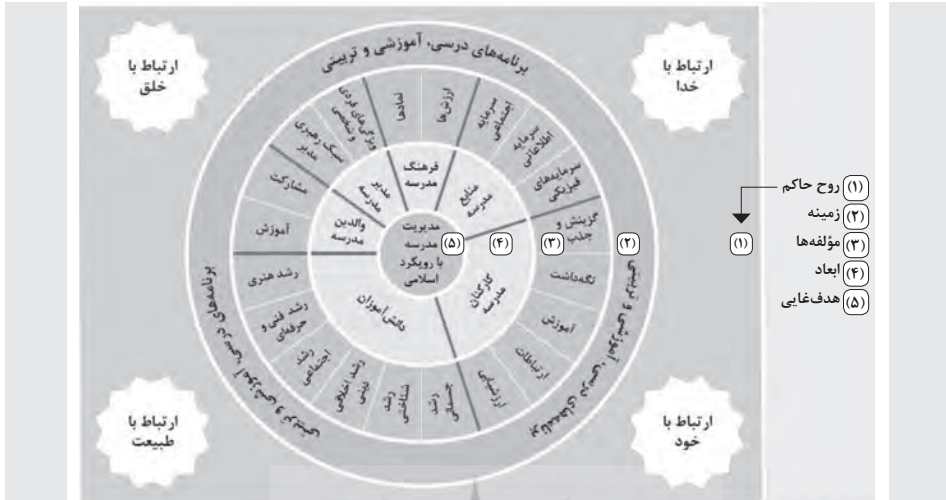
نمودار ۲. مدل مفهومی مدیریت مدرسه با رویکرد اسلامی

رابطه‌های چهارگانه مزبور را می‌توان به صورت نمودار ۳ ترسیم کرد. در اوصاف و نوع روابطی که بین این چهار رکن برقرار است، محوری‌ترین رابطه ارتباط با خداست (رکن اول)؛ چراکه نوع این ارتباط بقیه ارتباطات انسان را تبیین می‌کند و بر آنها تأثیر مستقیم می‌گذارد. ایجاد و اصلاح رابطه خود و خدا از مهم‌ترین هدف‌های مدیریت با رویکرد اسلامی است.