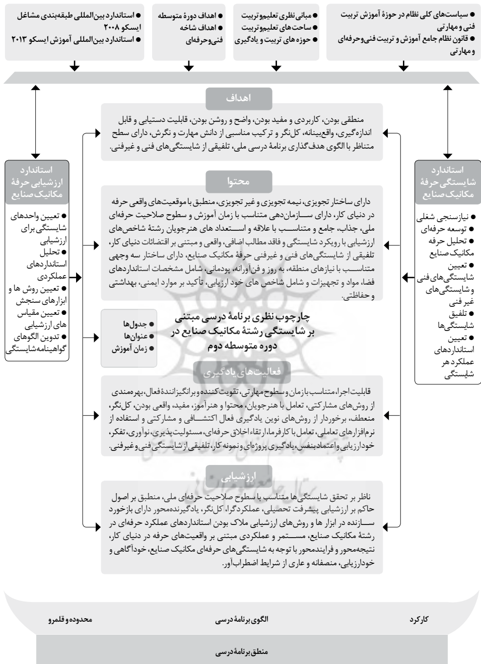
شکل ۱. چارچوب نظری برنامه درسی مبتنی بر شایستگی رشته مکانیک صنایع در دوره دوم متوسطه