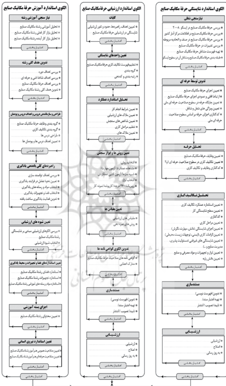
شکل ۲. الگوی پیشنهادی تدوین برنامه درسی مبتنی بر شایستگی رشته مکانیک صنایع

طراحی چارچوب برنامه درسی مبتنی بر شایستگی رشته مکانیک صنایع دوره دوم متوسطه