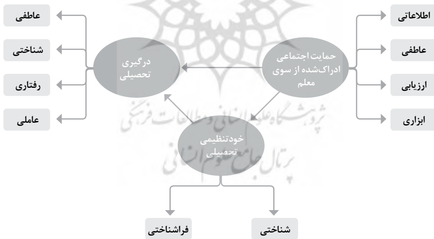
نمودار ۱. مدل پیشنهادی پژوهش

مرور پژوهش‌های گذشته شواهدی مبنی بر ارتباط بین تمامی متغیرهای پژوهش حاضر در قالب هم‌بستگی‌های دو متغیری را نشان می‌دهد. این در حالی است که برای رسیدن به درک جامع از این ارتباطات به بررسی بافتی، شامل تمامی متغیرهای نامبرده نیاز است. لذا در پژوهش حاضر سعی شده است، با یک رویکرد چندمتغیری بر اساس مدل ارائه‌شده در نمودار ۱، نقش واسطه‌ای خودتنظیمی در ارتباط بین حمایت اجتماعی ادراک شده از سوی معلم و درگیری تحصیلی مورد بررسی قرار گیرد.