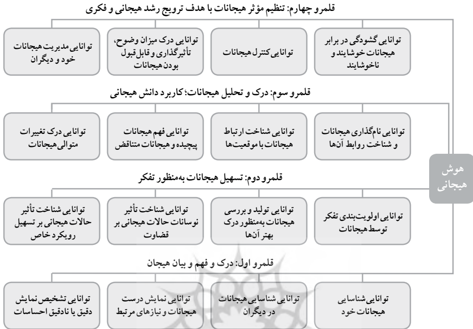
شکل ۱. قلمروهای هوش هیجانی: منبع: مایر و سالوی، ۱۹۹۷ (با تلخیص)

در ادامه، آن دسته از فعالیت‌های اجتماع پژوهشی که در ارتباط با ابعاد سه‌گانه تفکر مراقبتی انجام می‌شوند مورد بررسی قرار می‌گیرند و روشن می‌شود که هر فعالیت، مربوط به کدام نوع یا انواع تفکر مراقبتی است و با کدام توانایی یا توانایی‌های مربوط به هوش هیجانی ارتباط دارد.