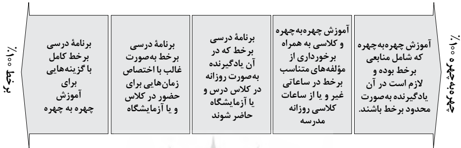
شکل ۱. پیوستار یادگیری ترکیبی (بلکبورد، ۲۰۰۹)

اگر بخواهیم تعاریف ارائه‌شده را علی‌رغم وجود وجوه اشتراک و افتراق در یک بیان واحد و خلاصه‌شده بگنجانیم، می‌توان گفت که یادگیری ترکیبی نقطه‌ای است که یادگیری چهره به چهره و برخط، با هدف رفع محدودیت‌های خود و برخورداری از نقاط قوت رویکرد مقابل، با یکدیگر ترکیب می‌گردند که، بسته به میزان ترکیب و تلفیق این دو رویکرد، پیوستاری از یادگیری ترکیبی ایجاد می‌گردد (شکل ۱).