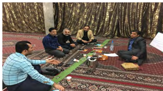
تصویر ۲. کارگاه مشارکتی مسئولان اجرایی.