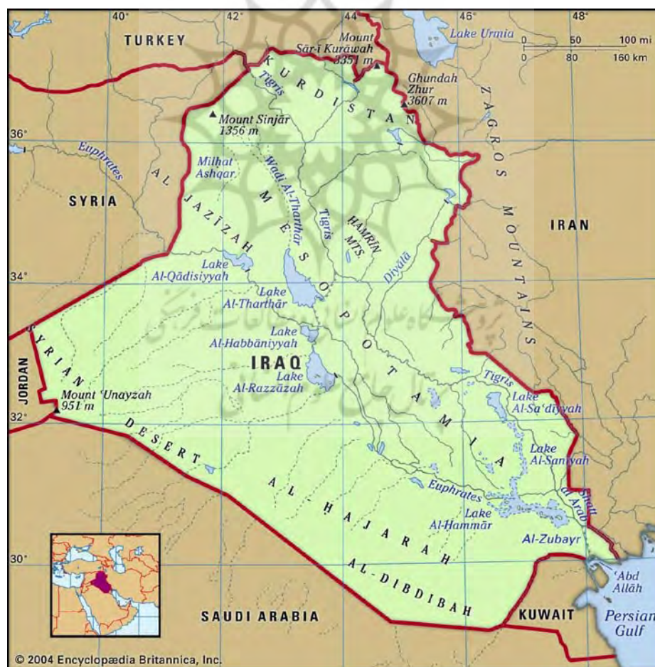
نقشه ۴: تقسیمات داخلی کشور عراق

علت تعصبات مذهبی با خشونت همراه بود و همین خصوصیت زیان‌هایی به بار آورد، در عین حال نشانه واقع‌نگری سیاسی آنان در آن زمان است. شاه اسماعیل و مخصوصاً شاه عباس اول کوشیدند که با ایجاد استقلال مذهبی از دنیای اسلام تسنن استقلال سیاسی ایران را حفظ کنند و ایران را از پیروی از قدرت بزرگ سنی مذهب آن روز (امپراطوری عثمانی که ادعای خلافت بر مسلمانان را می‌نمود) دور نگه دارند (اقدام راهبردی فوق‌بیانگر تفکر ژئواستراتژیکی این دو پادشاه صفوی است). سلطان سلیم اولین پادشاه عثمانی بود که تصمیم گرفت بر خلاف سایر حکام عثمانی که به غرب و سرزمین‌های اروپایی لشکرکشی کردند، به جنوب، مکه و مدینه و شرق (ایران) حمله کند. او در حمله به ایران چهل هزار نفر از شیعیان ترک را که مقیم خاک عثمانی بودند، به قتل رساند و پیشانی شیعیان زیادی را با آهن گداخته داغ کرد تا از دیگران متمایز شوند. به تحقیق می‌توان گفت تا قبل از برقراری نفوذ اروپائیان و مخصوصاً انگلستان در منطقه خاورمیانه و خلیج‌فارس مذهب در تداوم اختلاف و بروز جنگ‌های مکرر بین دو کشور نقش عمده‌ای داشته است. کارگزاران عثمانی در بین‌النهرین با ایرانیانی که قصد زیارت عتبات عالیات را داشتند بدرفتاری می‌کردند و ایرانیان نیز علاقه داشتند شهرهای مذهبی خویش را در داخل مرزهای خود داشته باشند (Ghasemi et al., 2017).