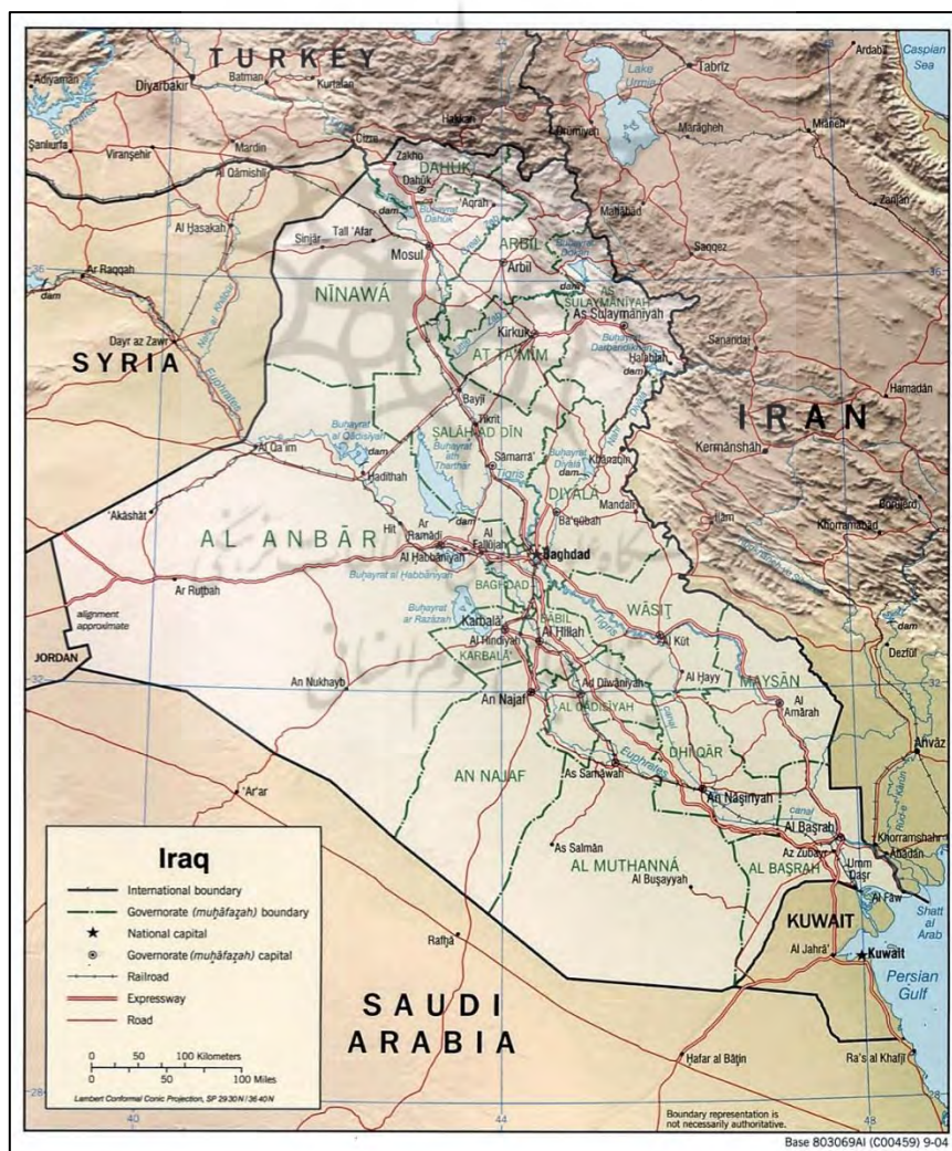
نقشه ۲: مرز ایران و عراق

آموورها سقوط نمود. سلسله بعدی هیت‌ها بودند که از آسیای صغیر وارد بین‌النهرین شده و با تشکیل کاسیت به مدت ۵۰۰ سال تا ۷۲۲ قبل از میلاد بر بین‌النهرین حکومت کردند. آشوری‌ها برای انتقام گرفتن از هیت‌ها از شمال به سمت جنوب هجوم آوردند و سلسله کاسیت را شکست دادند. امپراطوری بابل در سال ۵۳۹ ق.م به دست کوروش منقرض شد. امپراطوری کوروش به دست اسکندر مقدونی پایان یافت و امپراطوری اسکندر بین سرکردگان سپاه وی تقسیم شده و ایران و مصر به سلوکوس سرسلسله سلوکی داده شد و سلوکی‌ها به دست اشکانیان از بین رفتند و امپراطوری اشکانی در سال ۲۱۶ میلادی منقرض گردید و بخش شرقی آن در اختیار ساسانیان و قسمت غربی به دست رومیان افتاد (Khosrow et al., 2018). با ظهور دین مبین اسلام، امپراطوری ساسانی مغلوب مسلمانان شد، پس از رحلت حضرت رسول (ص)، سپاه اسلام سرزمین بین‌النهرین را تصرف کرد و مردم آن، اسلام را پذیرفتند و نام عراق بر این سرزمین گذارده شد. سپس به تصرف امپراطوران عثمانی درآمد و پس از شکست عثمانی‌ها، در پایان جنگ جهانی اول، سرزمین عراق زیر نظر دولت انگلیس قرار گرفت و در سال ۱۹۳۲ میلادی استقلال پیدا کرد و رژیم سلطنتی امیرفیصل در آن کشور برقرار شد (Akhbari, 2017).