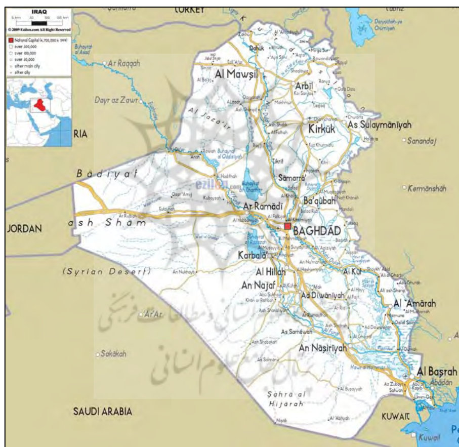
نقشه ۵: مناطق مرزی ایران و عراق

علی بابا و چهل دزد (اربعین حرامی) و شهرزاد قصه گو از جمله میادین مرکزی بغداد هستند. حسینیه‌های اصفهانی‌ها، یزدی‌ها، قمی‌ها و... هنوز در کربلا و نجف پا برجا است. با این وجود ناسیونالیسم عربی که نماد آن در حزب بعث تجلی یافته بود به دنبال نفی تأثیرات عمیق فرهنگ ایرانی بر جامعه عراق بود و آن‌گونه کردند که جنگی هشت ساله را بر دو ملت تحمیل نمودند. آنها می‌گویند اساساً شیعیان، ایرانیانی هستند که به عراق آمده‌اند و یا کوچ داده شده‌اند و ثانیاً شیعه یک حزب و یک طایفه ایرانی است که در اثر مبارزات ناسیونالیستی ایرانیان بر ضد اعراب (به دلیل حمله اعراب مسلمان در صدر اسلام بر سرزمین پارس و اسلام اجباری ایرانیان) به وجود آمده است (Ghorbani Nejad, 2019).