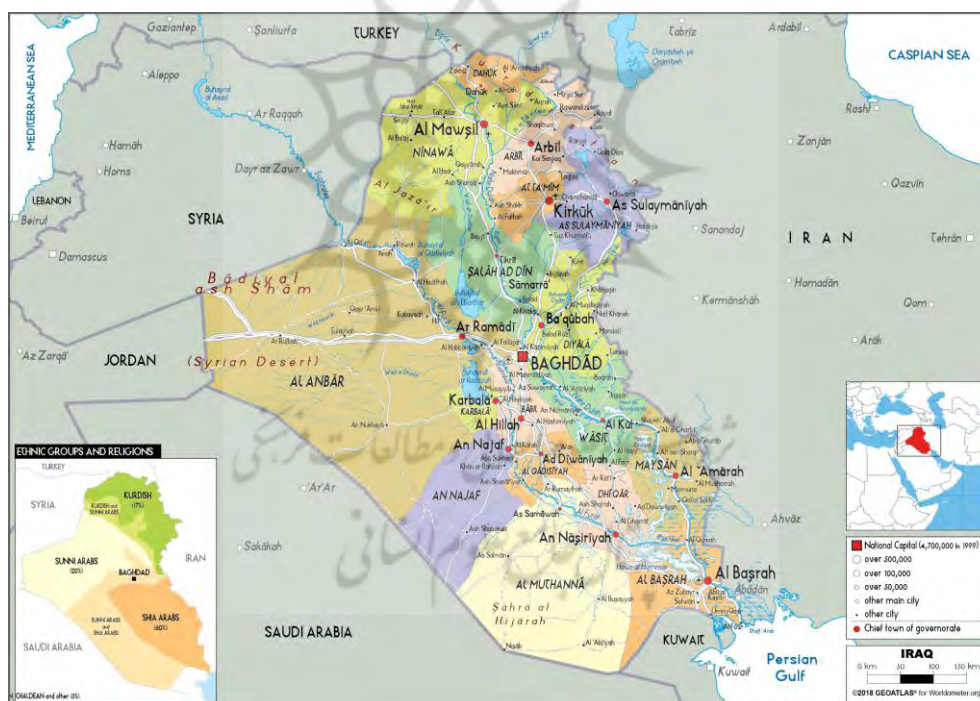
نقشه ۱: موقعیت کشور عراق

است یکی از ویژگی‌های ژئوپلیتیک بارز عراق بافت جمعیتی - فرهنگی آن است (Pourhossein and Akhbari, 2009). به لحاظ ژئواستراتژیک، این ویژگی‌های ژئوپلیتیکی از چنان قابلیت انعطاف - همگرایی و در مقابل سختی - واگرایی با محیط پیرامونی برخوردار است که می‌توان برای آن نقش تعیین کننده‌ای در دورنمای ژئوپلیتیک خاورمیانه متصور بود. از لحاظ ساختار قومی جمعیت عراق به طور عمده مرکب از اعراب، کردها، ایرانیان، آشوریان، ارمنه، ترکمن‌ها و ترک‌ها می‌باشد. قوم عرب که از نژاد سامی است ۷۰ درصد جمعیت عراق را تشکیل می‌دهد و اکثریت آنها شیعه هستند. کردها که از نژاد آریایی هستند و در طول تاریخ، سنت‌ها، آداب، فرهنگ و زبان خود را حفظ نموده‌اند، در منطقه شمال عراق سکونت دارند و حدود ۱۸ درصد جمعیت عراق را تشکیل می‌دهند. اکثر آنها نیز سنی می‌باشند. عراق به لحاظ تاریخی میدان منازعه دو امپراطوری ایران و عثمانی طی قرن‌های ۱۵ و ۱۶ بوده است. ایالت‌های موصل، بصره و بغداد طی ۲۴۵ سال (تاجگذاری شاه اسماعیل صفوی در ۱۵۰۱ میلادی تا قرارداد کردان) بارها بین ایران و عثمانی دست به دست شدند و در دهه دوم قرن ۲۱ نیز با سقوط صدام حسین، ژئوپلیتیک عراق دروازه تأثیرگذاری ایران بر تحولات منطقه خاورمیانه و رویارویی ایران و آمریکا، همچنین ایران و رقبای منطقه‌ای نظیر عربستان و ترکیه گردید (Jamshidi et al., 2018).