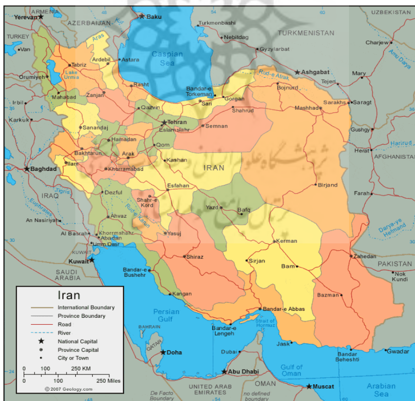
نقشه ۱: موقعیت ایران

ایران سرزمینی است در غرب آسیا که از شمال به کشورهای ارمنستان، جمهوری آذربایجان، جمهوری ترکمنستان و دریای خزر و از خاور به ترکمنستان، افغانستان و پاکستان و از جنوب به دریای عمان و خلیج فارس و از غرب به عراق و ترکیه محدود است. مساحت این کشور ۱۶۴۸۱۹۵ کیلومتر مربع بوده که از نظر وسعت هفدهمین کشور جهان به شمار می‌آید (Atlas of New Gita Studies, 2005). ایران به دلیل برخورداری از پتانسیل‌هایی چون موقعیت ممتاز ژئوپلیتیک، منابع فراوان، نزدیکی جغرافیایی به دریاهای آزاد و تنگه استراتژیک هرمز، توانایی تبدیل به قدرت برتر در خاورمیانه را دارد. (Nami and Abbasi, 2009: 41)