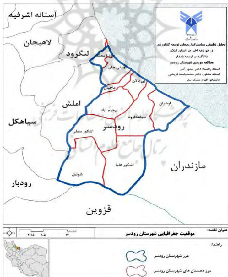
شکل ۲: موقعیت جغرافیایی شهرستان رودسر

آب‌وهوای نواحی ساحلی و جلگه‌ای شهرستان رودسر معتدل و مرطوب و مساعد است و آب‌وهوای مناطق کوهستانی دارای زمستان‌های سرد و برفی و در تابستان‌ها نیمه مرطوب و دارای شرایط متعادلی است. میزان بارندگی در شهرستان رودسر سالانه ۱۲۰۱ میلی‌متر و میزان گرما تحت تأثیر عوامل و عناصر گوناگون و به‌ویژه ارتفاع و عرض جغرافیایی و میزان تابش خورشید از منطقه‌ای به منطقه‌ای دیگر تغییراتی را نشان می‌دهد. در ماه‌های اردیبهشت و خرداد و تیر، مرداد، شهریور و مهر درجه‌ی حرارت ماهانه از حد متوسط (۱۶/۵) بیشتر و مابقی ماه‌های سال درجه‌ی حرارت از متوسط سالیانه کمتر می‌باشد. حداقل درجه‌ی حرارت متوسط ماهانه مربوط به دی و بهمن با ۸/۱ درجه سانتی‌گراد و حداکثر آن مربوط به تیرماه ۲۵/۷ درجه است. حداکثر بارش در مهرماه به میزان ۲۴۴/۶ میلی‌متر (۲۰/۴ درصد) بارش سالانه و حداقل بارش در تیرماه به میزان ۳۶/۸ میلی‌متر (۳/۱ درصد) از بارش سالانه است.