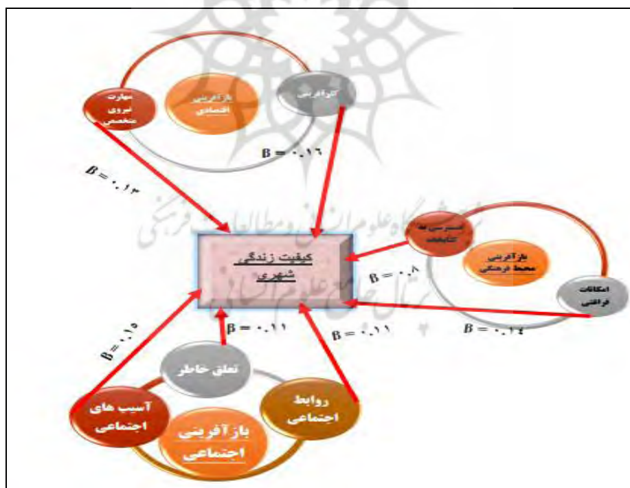
دیاگرام ۲: تحلیل تأثیرات مؤلفه‌های متغیر مستقل بر وابسته (از دیدگاه شهروندان)

از جمله روش‌های تحلیل چند متغیره می‌باشد که در مواقعی بکار می‌رود، محقق با مجموعه‌ای از متغیرهای وابسته و مجموعه‌ای از متغیرهای مستقل سروکار دارد. همبستگی کانونی در واقع همبستگی و روابط میان متغیرهای مستقل و وابسته را بررسی می‌کند. این آزمون همانند مدل‌سازی معادلات ساختاری و یا تحلیل عاملی تأییدی، عمل می‌کند. در واقع می‌توان گفت چقدر یک مجموعه از متغیرها، می‌توانند، رفتار مجموعه‌ای دیگر از متغیرها را پیش‌بینی و تبیین نمایند. متغیرهای کانونی در این تحقیق، شامل ۶ مجموعه متغیر است. (بازآفرینی اجتماعی، بازآفرینی اقتصادی، بازآفرینی فرهنگی، کیفیت زندگی بعد اجتماعی، کیفیت زندگی بعد اقتصادی، کیفیت زندگی بعد فرهنگی). وظیفه این تکنیک این است که رابطه میان این مجموعه را به دست آورد.