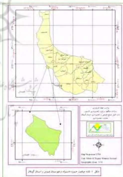
شکل ۱: نقشه موقعیت حوزه آبخیز ماسوله در استان