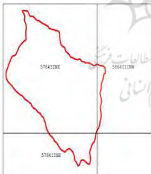
شکل ۲: موقعیت جغرافیایی حوزه های آبخیز منتخب در سه شیت

حوزه آبخیز ماسوله با وسعت ۴۱۹۵/۴۶ هکتار در قسمت غربی شهرستان فومن واقع شده است. حوزه آبخیز مورد مطالعه از نظر مختصات جغرافیایی در حد