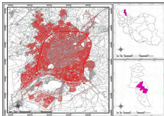
شکل شماره ۲. موقعیت جغرافیایی محدوده مورد مطالعه