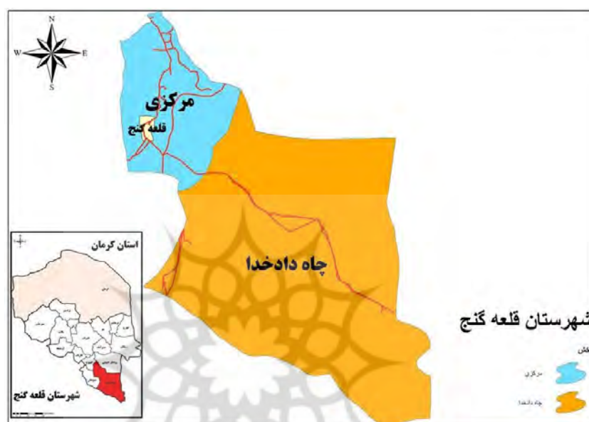
شکل ۱. نقشه موقعیت جغرافیایی محدوده مورد مطالعه

شهرستان قلعه گنج بین ۲۷ درجه عرضی و ۵۷ درجه طول جغرافیایی قرار گرفته است، از شمال به شهرستان کهنوچ، از جنوب به بندر جاسک، از جنوب شرق به استان سیستان و بلوچستان ( شهرستان های ایرانشهر و نیک شهر )، از شرق به شهرستان رودبار از غرب به منوجان محدود می‌شود. مساحت شهرستان ۱۴۲۰۰ کیلومتر مربع معادل ۳/۳ درصد از کل مساحت استان است و فاصله تا مرکز استان ۴۲۰ کیلومتر است. شهرستان قلعه گنج دارای ۲ بخش مرکزی و چاه دادخدا و ۵ دهستان به نامان دهستان رمشک، مارز، چاه دادخدا، قلعه گنج و سرخ قلعه است.