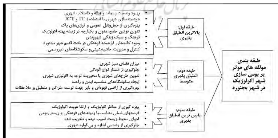
شکل ۳. طبقه‌بندی مؤلفه‌های بومی‌سازی شهر اکولوژیک در بجنورد براساس مقایسه نتایج دلفی و گروه اسمی منبع: نگارندگان

براساس این مقایسه، ملاحظه می‌شود که در هر دو روش، سه مؤلفه دقیقاً رتبه یکسان را کسب کرده‌اند. همچنین به‌جز مؤلفه‌های شماره ۳، ۶ و ۱۴ که اختلاف رتبه زیادی دارند، دیگر مؤلفه‌ها، رتبه تقریباً نزدیک در دو روش کسب کرده‌اند. بدین ترتیب، به‌نظر می‌رسد روش گروه اسمی، تأییدی بر نتیجه روش دلفی است. در این بخش، براساس مقایسه نتایج دو روش، یک طبقه‌بندی از مؤلفه‌ها ارائه می‌شود. این طبقه‌بندی براساس مقایسه رتبه‌ای است که هر مؤلفه در هر روش کسب کرده است. در این طبقه‌بندی، مؤلفه‌هایی که دارای کمترین میزان اختلاف رتبه هستند، به‌عنوان اطمینان‌بخش‌ترین مؤلفه‌ها و دارای بیشترین انطباق با یکدیگر (نتایج دو روش دلفی و گروه اسمی) مطرح می‌شوند. در طبقه اول مؤلفه‌های با اختلاف رتبه صفر یا ۱، در طبقه دوم مؤلفه‌های با اختلاف رتبه ۲ یا ۳ و در طبقه سوم مؤلفه‌های با اختلاف رتبه ۴ به بالا قرار دارند.