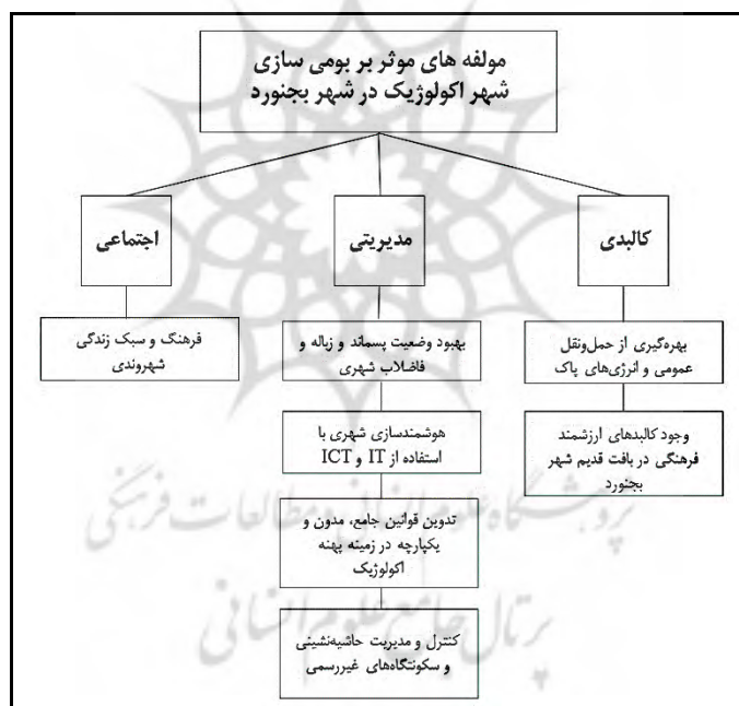
شکل ۴. مؤلفه‌های مؤثر بر بومی‌سازی شهر اکولوژیک در شهر بجنورد

همان‌طور که ملاحظه می‌شود، شانزده مؤلفه‌ای که در نتیجه نهایی مصاحبه دلفی حاصل شده است، دارای مطابقت با نظریات اندیشمندان در منابع متنوع است. در مرحله بعد، برای اطمینان از نتایج پژوهش و رتبه اهمیت، بار دیگر مؤلفه‌ها به روش گروه اسمی رتبه‌بندی شدند که نتایج دو روش تا حدی به یکدیگر نزدیک بود. بدین‌صورت که سه مؤلفه دقیقاً رتبه یکسان و دیگر مؤلفه‌ها رتبه‌ای نزدیک به یکدیگر را کسب کرده بودند. در مرحله بعد، به مقایسه و بررسی تطبیق‌پذیری نتایج دلفی و گروه اسمی پرداختیم. طبقه‌بندی مؤلفه‌ها براساس میزان تطبیق‌پذیری نتایج حاصل از دو روش دلفی و گروه اسمی انجام شد. به این صورت که مؤلفه‌های دارای اختلاف رتبه صفر یا ۱ در طبقه بالاترین انطباق‌پذیری، اختلاف رتبه ۲ یا ۳ در طبقه انطباق‌پذیری متوسط و اختلاف رتبه بیشتر از ۴، در طبقه پایین‌ترین انطباق‌پذیری قرار دارند. بر این اساس، مؤلفه‌های طبقه اول را می‌توان به‌عنوان مؤثرترین مؤلفه‌ها در بومی‌سازی رویکرد شهر اکولوژیک در نظر گرفت؛ چراکه در مصاحبه‌ها و بحث‌های انجام‌شده با کارشناسان و امتیاز و رتبه‌ای که این مؤلفه‌ها در دو روش متفاوت کسب کرده‌اند، دارای جایگاهی تقریباً یکسان بوده‌اند؛ بنابراین، این مؤلفه‌ها دغدغه و مسئله اصلی کارشناسان برای تحقق رویکرد شهر اکولوژیک در شهر بجنورد است.