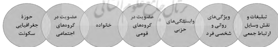
شکل ۱. عوامل مؤثر بر رفتار انتخاباتی منبع: بایی لاشکی و پیشگاهی فرد، ۱۳۸۸: ۹۶

در میان مراحل جدایی‌گزینی، مهاجرت گروه‌های انسانی و اسکان آن‌ها در محله‌های خاص فضاهای شهری به‌عنوان مرحله بنیادین جدایی‌گزینی اکولوژیکی قابل تبیین است. مهاجران، با هجوم به شهر یا محله مقصد، باعث تقویت گروه‌های هم‌نژادی، قومی، و اقتصادی می‌شوند و از این طریق بر همگرایی، اعتماد، توسعه، و تنوع اکولوژیکی شهر یا برعکس واگرایی، اختلاف، برخورد، و عقب‌ماندگی شهر و محله تأثیر می‌گذارند (حاجی‌نژاد و همکاران، ۱۳۹۴: ۳۷). مهاجران با کسب اطلاعات اولیه درباره شهر مقصد محل سکونت خود را براساس الگوی متناسب با اوضاع اجتماعی و اقتصادی خود برمی‌گزینند. این مکان‌گزینی ممکن است متأثر از علقه‌های قومی و نژادی باشد که به این ترتیب باعث تقویت گتوهای کوچک یا بزرگ قومی یا نژادی می‌شود (مرصوصی و همکاران، ۱۳۸۸: ۷۷) و نتیجه آن تشدید جدایی‌گزینی فضایی و اکولوژیکی در شهرهاست (حاجی‌نژاد و همکاران، ۱۳۹۴: ۳۷). در این میان، شناسایی پیامدها و اثرهای این جدایی‌گزینی بر محیط‌های شهری و رفتارهای شهروندان بسیار مهم است (اعظم‌آزاده، ۱۳۸۳: ۲۶). رفتار انتخاباتی، به‌مثابه نوعی کنش سیاسی، عبارت است از کنشی که مردم در انتخابات و رأی‌دادن انتخاباتی با تأثیرپذیری از عوامل مختلف از خود نشان می‌دهند (قجری و همکاران، ۱۳۹۰: ۱۴۱). در بررسی الگوهای رفتارهای انتخاباتی دیدگاه‌های متفاوتی وجود دارد؛ آنچه از مجموع آرا و دیدگاه‌ها برمی‌آید این است که عوامل مختلف و متفاوتی توأمان در رفتار رأی‌دهی افراد مؤثرند. برخی عوامل مؤثر در رفتار انتخاباتی افراد در شکل ۱ آمده است.