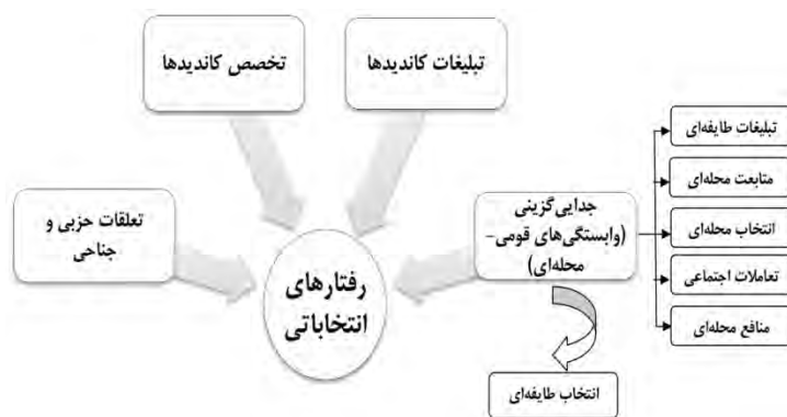
شکل ۲. عوامل و شاخص‌های مؤثر بر رفتار انتخاباتی شهروندان

درواقع، در جریان انتخابات مختلف و در چارچوب ساختارهای اجتماعی - اقتصادی حاکم بر عرصه‌های یک سرزمین، رأی‌دهندگان ممکن است از مؤلفه‌های متفاوتی همچون گرایش‌های سیاسی ثابت، ویژگی‌های فردی و شخصیتی، توجه به برنامه‌ها و اهداف، وابستگی‌های حزبی - خانوادگی، تبلیغات، و نقش وسایل ارتباط جمعی و همچنین عضویت در گروه‌های قومی و تعصب بر هویت مکانی/ فرهنگی خاص برای تصمیم‌گیری و رأی‌دهی به نامزدهای موردنظر استفاده کنند (شمس‌الدینی، ۱۳۸۹: ۱۳). در شهرها و محلات مبتنی بر نظام طایفه‌ای مشارکت سیاسی و رأی‌دهی بر مبنای تعصب و هویت قومی/ طایفه‌ای یکی از انگیزه‌های افراد برای شرکت در انتخابات است. بنابراین، جدایی‌گزینی فضایی و اجتماعی می‌تواند جریان انتخابات را متأثر سازد. بر همین اساس، در این پژوهش برای بررسی و سنجش میزان تأثیر جدایی‌گزینی اکولوژیکی بر رفتارهای انتخاباتی از چهار شاخص اصلی - جدایی‌گزینی اکولوژیکی (وابستگی‌های قومی - محله‌ای)، تبلیغات، میزان تخصص کاندیداها، و تعلقات حزبی و جناحی - استفاده شده است.