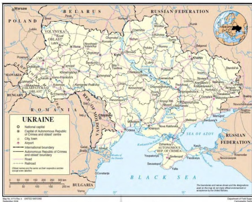
نقشه ۲. موقعیت ژئوپلیتیک اوکراین و شبه‌جزیره کریمه

اوکراین از نظر صنعتی و اقتصادی دومین جمهوری مهم شوروی سابق پس از روسیه به‌شمار می‌رود. به دلیل خاک حاصل‌خیز، کشاورزی اساس اقتصاد سنتی اوکراین را تشکیل می‌دهد. در قرن نوزدهم، اوکراین به دلیل صدور مقادیر زیادی از گندم به‌دست‌آمده از زمین‌های سیاهش به اروپا «سبد نان اروپا» شهرت داشت. بخش صنعت نیز در اوکراین سهم قابل توجهی از درآمدهای ناخالص داخلی این کشور را تشکیل می‌دهد. به‌طور کلی، بخش صنایع سنگین (فلزکاری، تولیدات شیمیایی، ساخت قطار، وسایل راه‌آهن، تراکتورسازی، و موتور ماشین) نسبت به سایر رشته‌های صنعت از تفوق فراوانی برخوردار است. در زمان اتحاد جماهیر شوروی، بخش مهمی از صنایع نظامی اتحادیه در اوکراین قرار داشت. مشهورترین کارخانهٔ موشک‌سازی در دنیپروپتروفسک ۱ قرار داشت که پنجاه‌هزار نفر در آن کار می‌کردند (صفری و وثوقی، ۱۳۹۵: ۱۱۸). با فروپاشی شوروی از تنش‌های سیاسی بین دو کشور همسایه- روسیه و اوکراین- کاسته نشد و در بسیاری از مسائل همچون افرادی که در کریمه هستند، تقسیم ناوگان شوروی در دریای سیاه، حق روسیه در استفاده از پایگاه دریایی سواستوپل، استفاده از امکانات نظامی در کریمه، و وضعیت پرسنل‌های نظامی روسیه در خاک اوکراین و ... این مناقشات وجود داشت (بیلر، ۲۰۱۵: ۹). از سال ۱۷۸۳ که شبه‌جزیرهٔ کریمه به عنوان مرکز خانات کریمه ضمیمهٔ خاک روسیه شد، روسیه ناوگان دریایی خود را در دریای سیاه و در بندر سواستوپل استقرار داد. این شهر در واقع به دلایل استراتژیکی و دسترسی به مسیرهای تجاری دریای سیاه، قفقاز، و روسیه، به روسیه اجازه می‌داد تا بتواند قدرت دریایی خود را در دریای مدیترانه گسترش دهد. بر همین اساس، اهمیت این پایگاه از سال ۲۰۰۸ برجسته‌تر شد (پائول، ۲۰۱۵).