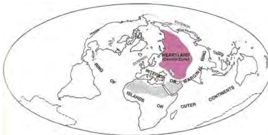
نقشه ۱. هارتلند مدنظر مکیندر

از نظر آلفرد ماهان، سرزمین نیم کره شمالی، که بخش‌های گسترده‌ای از آن از طریق گذرگاه‌های آبی دو کانال پاناما ۱ و سوئز ۲ به یکدیگر متصل‌اند، کلید قدرت جهانی‌اند و در داخل این نیمکره اوراسیا مهم‌ترین حوزه است. ماهان روسیه را به‌عنوان قدرت مسلط زمینی که مکان آن غیرقابل تهاجم است مورد تأیید قرار می‌داد. وی بر آن بود که منطقه حیاتی منازعه میان عرض‌های جغرافیایی ۳۰ و ۴۰ قرار دارد؛ جایی که قدرت زمینی روسیه و نیروی دریایی بریتانیا به یکدیگر می‌رسند (کوهن، ۱۳۸۷: ۵۰).