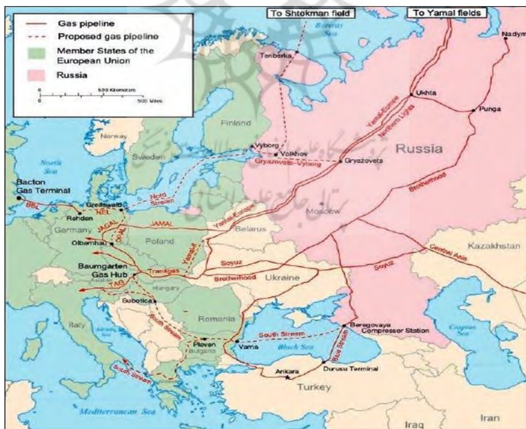
نقشه ۳. جایگاه اوکراین در انتقال انرژی از روسیه به اتحادیه اروپا