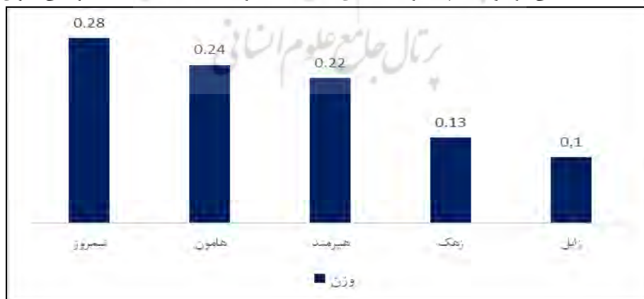
شکل ۴- وزن نهایی گزینه‌ها براساس شاخص‌های میزان تأثیر خشکسالی بر توسعه پایدار اقتصادی منطقه سیستان