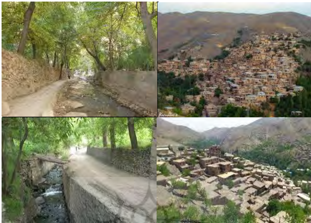
شکل ۲- تصاویری از روستای زیبای کنگ (ماسوله خراسان) شهرستان طرهبه شاندریز