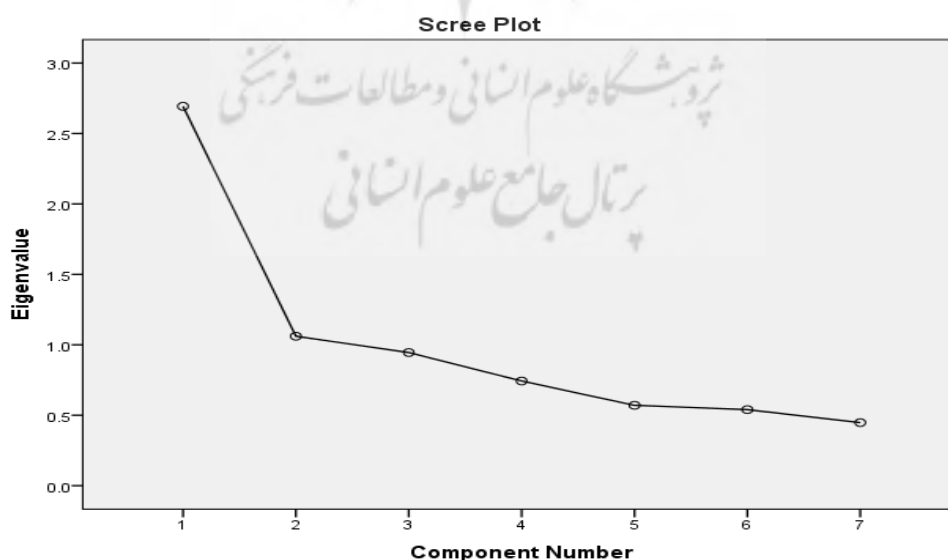
شکل ۳- نمودار سنگریزه عامل‌های تحقیق براساس شاخص‌ها

جدول (۵) نشان دهنده مقادیر ویژه عوامل استخراجی با چرخش واریماکس می‌باشد. شاخص‌های وارد شده به تحلیل عاملی اکتشافی، سرمایه اقتصادی و دارایی‌ها، اشتغال، هزینه و درآمد، خسارت، ظرفیت و توانایی جبران خسارت، توانایی بازگشت به شرایط شغلی و درآمدی مناسب و بهره‌مندی از منابع بانکی می‌باشند. بر اساس نتایج دو عامل دارای مقدار ویژه بزرگ‌تر از یک هستند و در تحلیل باقی می‌مانند. با توجه به ستون واریانس تجمعی نسبی، این دو عامل می‌توانند ۵۳/۶ درصد از تغییرپذیری (واریانس) متغیرها را توضیح دهند. لازم به ذکر است در روش چرخش عامل‌ها، هر یک از آنها نسبت تقریباً یکسانی از تغییرات را توضیح می‌دهند اما در روش بدون چرخش، عامل اول درصد بیشتری از تغییرات (۳۸/۴۷ درصد) را تعیین می‌کند. همچنین شکل (۳) نمودار سنگریزه عامل‌های تحقیق براساس شاخص‌های مورد استفاده است که نقاط برش عامل‌ها را نمایش می‌دهد.