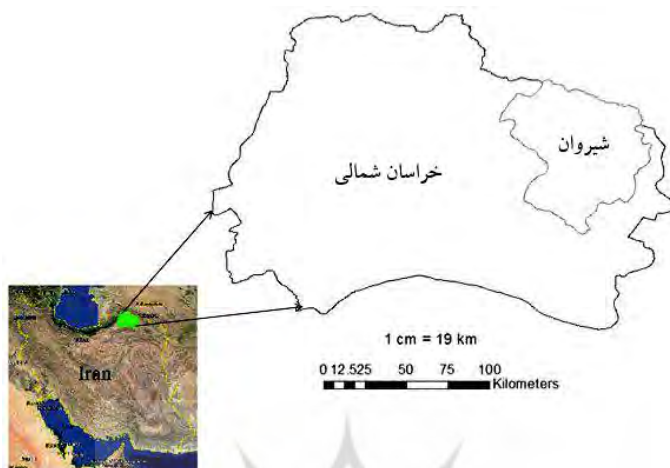
شکل ۲. موقعیت منطقه مورد مطالعه

سطح تحلیل این تحقیق خرد و واحد تحلیل فرد ( به‌عنوان سرپرستان خانوار) در نظر گرفته شده است. برای پراکنش مناسب خانوارهای مورد آماربرداری، به کمک نرم‌افزار ArcGIS، بر روی نقشه شیروان، شبکه‌ای از خطوط (۳۰ در ۳۰ متر) طراحی گردید.