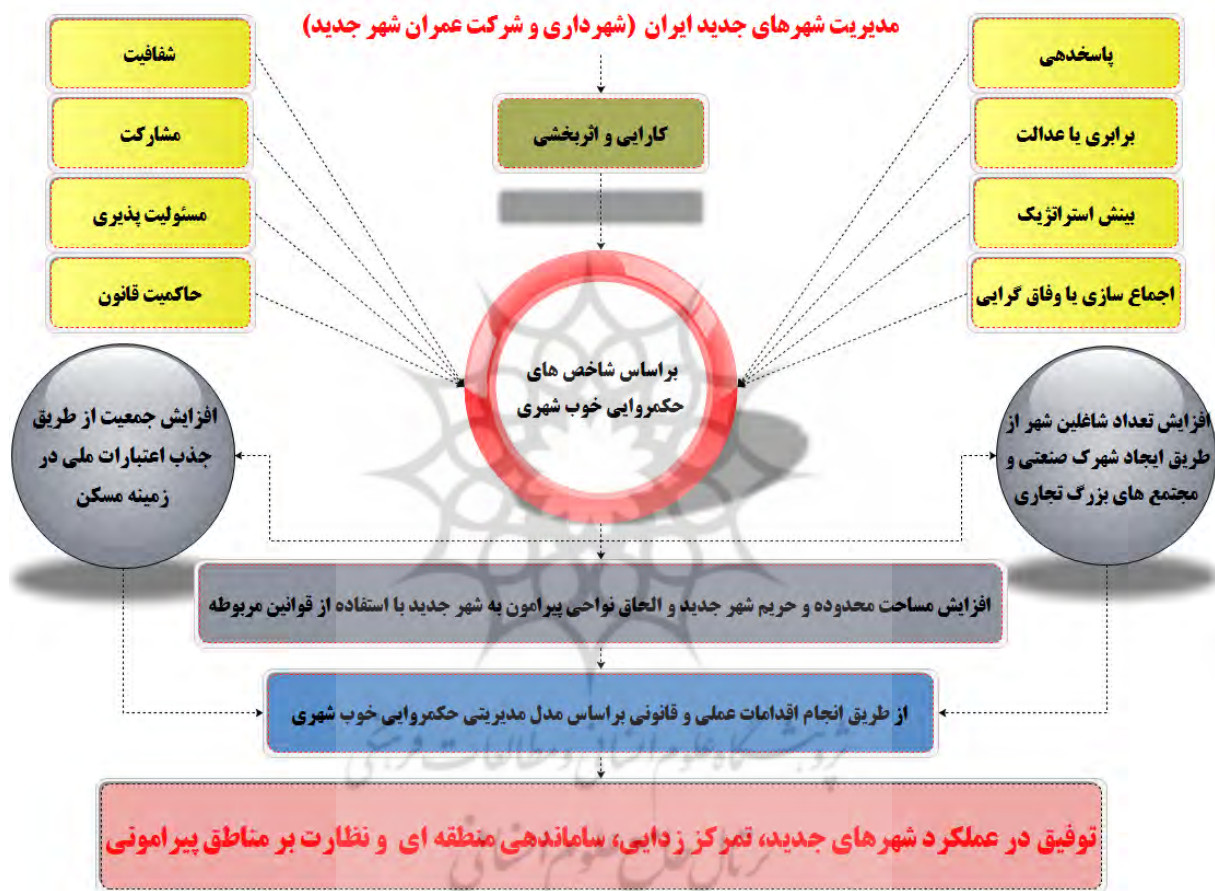
نمودار ۴. الگوی مدیریتی پیشنهادی شهرهای جدید ایران برای مرکزیت‌یابی در تقسیمات کشوری (منبع: یافته‌های تحقیق، ۱۳۹۸)

به دلیل استفاده از پتانسیل‌های شهر و منطقه خود از نظر افزایش جمعیت، افزایش فرصت‌های شغلی، افزایش محدوده تحت نظارت مدیریت شهر جدید، پیش‌بینی می‌شود در تقسیمات کشوری حائز جایگاه مرکزیت بخش یا شهرستان شود. بر مبنای نتایج و همچنین تلفیق مبانی نظری پژوهش با تحلیل