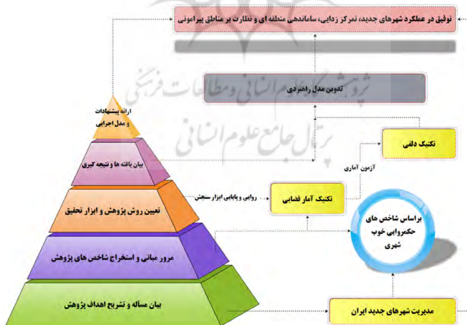
نمودار ۲. مدل عملیاتی پژوهش

در مرحله دوم برطبق اظهارنظرها و پیشنهادهای ۷ نفر از خبرگان (اجرایی و دانشگاهی) براساس تکنیک دلفی، شاخص‌های ۹ گانه در ۲۰ گویه تنظیم شد. در ادامه از روش نمونه‌گیری هدفمند (مصاحبه با تعداد ۲۵ نفر از کارشناسان) و به‌کارگیری ابزار پرسشنامه و نظرسنجی، اطلاعات گردآوری و برای اثبات نرمال بودن