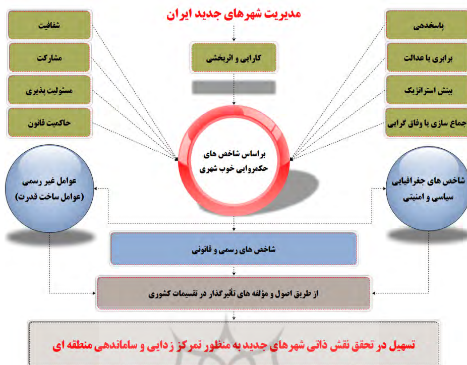
نمودار ۱. چارچوب نظری تبیین مدیریت شهرهای جدید ایران از منظر تقسیمات کشوری