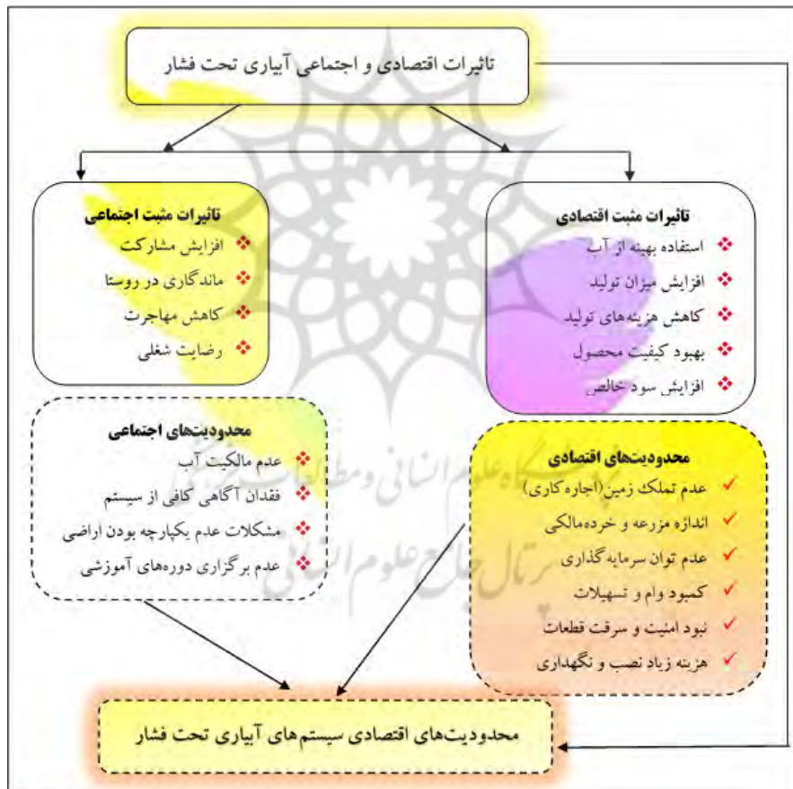
شکل ۱: مدل مفهومی تحقیق

عدم تملک زمین (اجاره‌کاری)، عدم مالکیت منابع آبی، عدم توان مالی در جهت سرمایه‌گذاری در استفاده