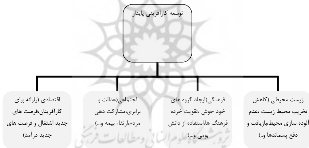
شکل (۱). آثار توسعه کارآفرینی پایدار

کارآفرینی پایدار شامل ابعاد اقتصادی (ایجاد و افزایش فرصت‌های جدید شغلی (زنان و مردان)، ایجاد زمینه‌ای جدید برای توسعه سرمایه‌گذاری، تنوع‌بخشی به اقتصاد روستا، پویا و محرک سازی اقتصاد روستا)، اجتماعی (آینده‌نگری، تأمین نیازهای آیندگان، بهبود سلامت جامعه، ارتقا کیفیت زندگی، عدالت اجتماعی، مشارکت مردمی، حس مشارکت‌پذیری، تصمیم‌گیری جمعی)، زیست‌محیطی (محیط‌زیست، بوم‌شناسی) و فرهنگی (نگرش، ریسک‌پذیری، منزلت اجتماعی، مسئولیت اجتماعی) بوده و در این موارد مورد بررسی قرار می‌گیرد. کارآفرینی پایدار یک مفهوم در پیوند توسعه پایداری به کارآفرینی است. کارآفرینی پایدار به‌عنوان یک اصطلاح جمعی برای کارآفرینی محیط‌زیست، کارآفرینی سبز و کارآفرینی اجتماعی در نظر گرفته می‌شود (سپه پناه و موحدی، ۱۳۹۴: ۲۱). به‌صورت کلی و بر اساس موارد گفته‌شده، می‌توان آثار توسعه کارآفرینی پایدار را در چارچوب شکل (۱) ترسیم نمود.