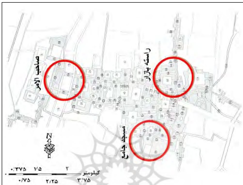
شکل (۱). موقعیت قرارگیری محدوده‌های مورد مطالعه‌ی در سطح بازار تبریز