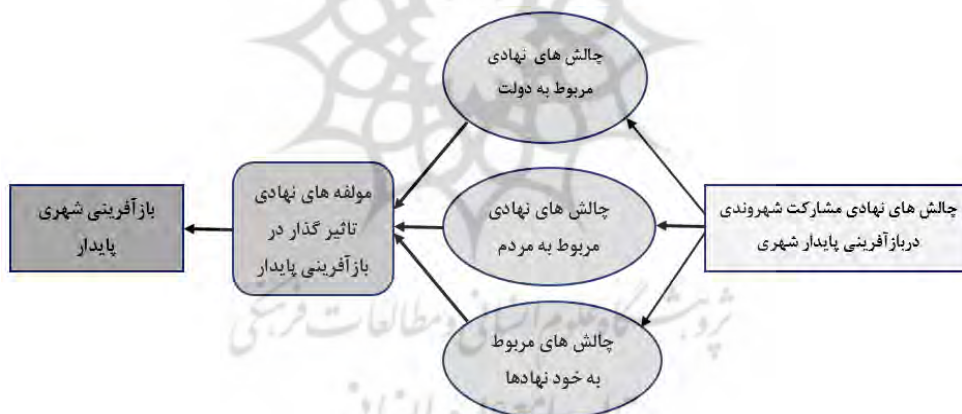
شکل (۳). مدل مفهومی پژوهش

بخش کیفی: در مطالعه حاضر به منظور بررسی جامع نگر موضوع، از ابزار مصاحبه نیز استفاده شد جامعه مورد مطالعه برای مصاحبه از میان مدیران و کارشناسان سازمانهای مرتبط با موضوع پژوهش (اداره راه و شهرسازی، شهرداری‌ها و...) به صورت هدفمند انتخاب شد. مصاحبه با این سؤال باز که به نظر شما مؤلفه‌های مؤثر در چالش‌های نهادی مشارکت شهروندی در بازآفرینی پایدار شهری در شهر تبریز کدامند؟ آغاز شد. پس از انجام ۱۵ مصاحبه به طول بیش از ۱۰ ساعت، اشباع تئوریک ۱ به دست آمد. و فرایند جمع آوری داده‌ها خاتمه یافت. به دلیل حجم بالای داده‌ها در پژوهش‌های کیفی و تحلیل زمان بر بودن آنها، بهتر است از نرم افزارهای کیفی استفاده شود. (Morse & Richard, 2012:13) براین اساس از نرم افزار NVivo10 برای تجزیه تحلیل مصاحبه‌های میدانی استفاده شد. بدین ترتیب پس از پیاده سازی مصاحبه‌ها، هر یک در قالب فایل جداگانه‌ای در نرم افزار Word تایپ شد و با فراخوانی فایل‌ها در محیط نرم افزار NVivo10 کد گذاری مصاحبه‌ها انجام شد، پس از تکمیل فرایند کد گذاری، تمام استدلال‌های مطرح شده در مطالعات مرتبط استخراج شدند.