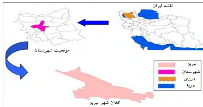
شکل (۲). موقعیت شهر تبریز در شهرستان، استان و کشور