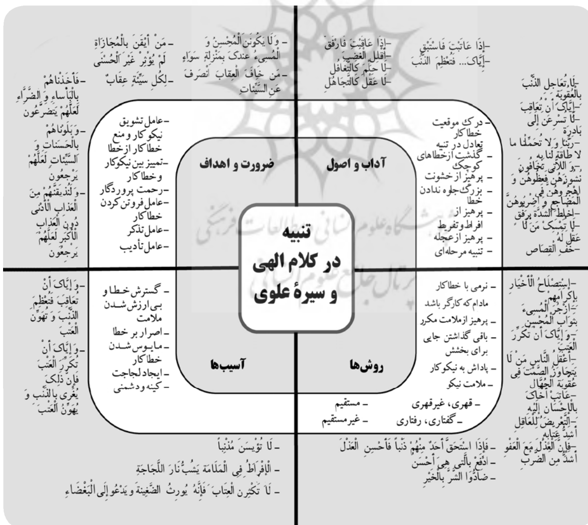
نمودار ۳. الگوی نهایی تحقیق

دلیل تنبیه و مصداق تنبیه»، «گذشت از خطاهای کوچک»، «سخت نگرفتن بر خطاکار»، «تناسب تنبیه با مقدار جرم و طاقت خطاکار». در این تحقیق روش‌های متعددی برای تنبیه ارائه شد که البته با «آداب و اصول تنبیه» ملازمت دارند و ضرورت دارد در فرایند تنبیه، روش متناسب با اوضاع و احوال خطاکار به کار برده شود؛ این روش‌ها بر اساس سیره علوی عبارت‌اند از: «تنبیه گفتاری» و «تنبیه رفتاری» شامل «سکوت»، «کنایه برای عاقلان و تصریح برای جاهلان» «پاداش دادن به نیکوکاران» «احسان و ملاحظت نسبت به خطاکاران و دفع بدی با خوبی». پس از احصای «اهداف»، «آداب و اصول» و «روش‌ها»، در نهایت، «الگوی تنبیه بر اساس کلام الهی و سیره علوی» ترسیم شد (نمودار ۳).