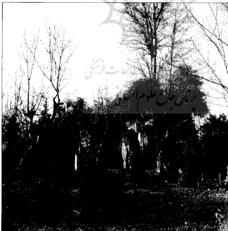
اسپیدمزگت سده چهارم هجری

حکم می راندند. حکومت آن ها به علت وجود روحیه استقلال طلبانه در مردم این منطقه و همچنین فعالیت علویان، با مشکلات عدیده ای توأم شده بود. یکی از عاملان سامانیان با اتخاذ سیاست مبتنی بر جلب اعیان و اشراف و سران محلی مخالف با علویان به سوی خویش، توانست حدود ده سال بخوبی حکم براند. لیکن با مرگ وی، این سیاست پیگیری نشد و سامانیان از حمایت این قشر محروم شدند. به علت زمینه فرهنگی نسبتاً مناسبی که بر اثر فعالیت های فرهنگی و مذهبی یکی از علویان به نام ناصر کبیر به وجود آمده بود، در سال ۲۰۱ هجری قیام مجددی در منطقه شکل گرفت که سامانیان یارای مقابله با آن را نیافتند.