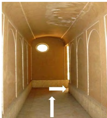
شکل ۲- برای ورود به خانه و تأمین محرمیت باید از دالان غیر مستقیم روبرو گذشت؛ درون خانه به هیچ وجه قابل رؤیت نیست

با روش های گوناگونی صورت می گرفته است، یکی دیگر از این روش ها، نحوه طراحی فضای ورودی به گونه ای است که هدف یا هدف های لازم را در چگونگی ایجاد ارتباط بین یک فضا با فضاهای پیرامون تأمین نماید. همان گونه که در قبل هم اشاره گردید در خانه ها به دلیل این که نمی خواستند شخص نامحرم از جلوی فضای ورودی به داخل خانه دید داشته باشد و نیز برای تأمین حداکثر محرمیت و در برخی از شهرها و دوره ها برای تأمین حداکثر محرمیت سعی می کردند مسیر حرکت در داخل فضای ورودی را تا حد امکان طولانی و غیر مستقیم نمایند (شکل شماره ۲).