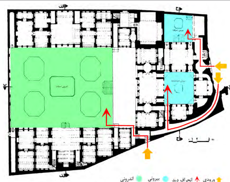
شکل ۱- خانه آل یس کاشان، ورودی غیر مستقیم به صورت مارپیچ و گذر از فضای پیشخوان، در ورودی، هشتی و دالان

شاردن که در دوره صفویه چند سال در ایران اقامت داشت درباره این موضوع چنین گفته است: «درب خانه کوچک است به طوری که نمی توان حدس زد که در پس آن خانه ای بدین بزرگی و زیبایی باشد» (ابوضیا و قزلباش، ۱۳۶۴: ۱۷۰). در معماری خانه های سنتی درهای ورودی منازل بسیار کوچک اند و در بدنه دیوارهای مشرف به کوچه ها غالباً پنجره ای برای عدم دید از خارج به داخل دیده نمی شود. این درها تنها چیزی است که در شهرها به چشم می خورد و باعث تعجب نیست که غریبه ای برای اولین بار به یک شهر در ایران قدم می گذارد راه را گم می کند زیرا نمایی وجود ندارد» (ناری قمی، ۱۳۸۹: ۷۵). در خانه های سنتی برای حفظ حریمیت ساکنان، مسیر فضای ورودی را به صورت پیچ در پیچ و غیر مستقیم طراحی کرده اند به نحوی که از جلوی در گاه یا هشتی نمی توان فضاهای داخلی را مشاهده کرد. این هدف بیشتر در طراحی فضای ورودی خانه های درون گرا در نظر گرفته می شد. ایجاد ارتباط بین یک فضای محصور با محیط پیرامون آن باید تابع ملاحظات کارکردی - اجتماعی متعددی باشد. در وهله ی نخست باید به خصوصیات کارکردی یک بنا به ویژه سلسله مراتب حریمیت آن توجه شود (سلطانزاده، ۱۳۸۴: ۱۶).