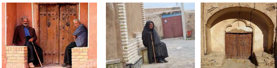
شکل ۴- خواجه‌نشین‌ها (پیرنشین) فرصتی برای حضور اجتماعی زنان در حریم خانه

برخی از اجزای فضاهای ورودی مانند صحن جلو خان، پیش طاق و هشتی، محل نشستن افراد و تجمع‌های کوچک و گاه بزرگ زنان و نیز برای برگزاری برخی مراسم بود. علاوه بر آن، در هر یک از دو سمت پیش طاق بسیاری از انواع بناهای خانه‌های سنتی خواجه نشیمنی ساختند که محل نشستن چند نفر بود. نشستن بر روی این سکوها و گفتگو برای انجام کارها یا گذران اوقات، یکی از الگوهای رفتاری زنان در گذشته بوده است. سکو عنصری است که عموماً به صورت زوج در دو سوی پیش طاق بسیاری از خانه‌ها ساخته می‌شده است. از این عنصر برای نشستن در جلوی یک خانه هنگام انتظار برای شخصی یا برای رفع خستگی استفاده می‌کردند (شکل شماره ۴).