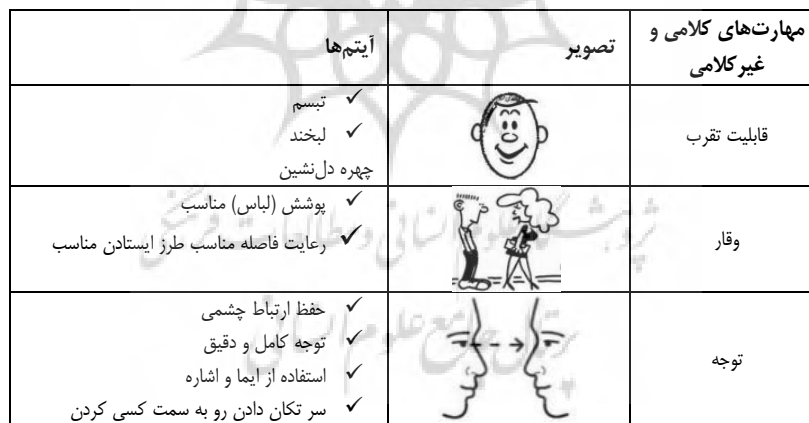
جدول (۱): مؤلفه‌های کلامی و غیرکلامی در شایستگی‌های ارتباطی بین فرهنگی

محققان شایستگی ارتباطی را به عنوان یکی از مؤلفه‌های مهم کیفیت راهنمایان تور در نظر می‌گیرند (لکلرک و مارتین ۱ ، ۲۰۰۴). کوهن (۱۹۸۵) ضمن تأیید اهمیت تعاملات بین گردشگران و راهنمایان تور، استدلال می‌کند که شایستگی ارتباطی راهنمایان تور بر موفقیت یا شکست کلی تجربه گردشگران تأثیر می‌گذارد. یکی از جامع‌ترین مطالعات در حوزه شایستگی‌های ارتباطی توسط مارتین، هامر و بردفورد (۱۹۹۴) انجام شده است که شامل طیف گسترده‌ای از مهارت‌های کلامی و غیرکلامی می‌شود. مارتین و همکاران (۱۹۹۴) ۳۲ شایستگی ارتباطی را در ۸ گروه شامل قابلیت تقرب، وقار، توجه، تماس، سازگاری زبانی، موضوعات فرهنگی، تعامل بین فردی و اذعان در بین دو گروه مکزیکی-آمریکایی و سفیدپوستان خود آمریکا بررسی کردند. در مطالعه دیگری لکلرک و مارتین (۲۰۰۴) تفاوت دیدگاه‌های آمریکایی‌ها با اروپایی‌ها شامل گردشگران دو کشور فرانسه و آلمان را درباره اهمیت شایستگی‌های ارتباطی بررسی کردند. آن‌ها استدلال کردند که شایستگی‌های ارتباطی برای گردشگران آمریکایی نسبت به گردشگران اروپایی اهمیت بیشتری دارد. هم‌چنین در مطالعه دیگری آل جهواری و همکاران (۲۰۱۶)، با قرار دادن هشت گروه از شایستگی‌های ارتباطی در شش گروه، آن‌ها با رویکرد عملکرد-اهمیت از دیدگاه راهنمایان تور ترکیه‌ای مورد بررسی قرار دادند. آن‌ها این شایستگی‌ها را بر اساس اینکه از نظر راهنمایان تور چه میزان اهمیت دارند و عملکرد راهنمایان در آن موارد چگونه بوده است، تجزیه و تحلیل کردند.