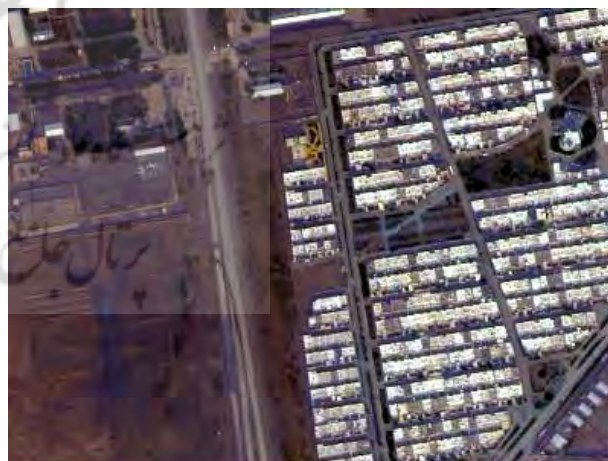
نگاره ۴. تصویر بالا: نتیجه ادغام با راهکار پنجم و تصویر پایین: نتیجه ادغام با راهکار دوم

راهکار پنجم بیشترین تأیید را از معیارهای طیفی دریافت نموده است. ولی در مقابل، در رابطه با معیار حفظ لبه‌ها رتبه هفتم را کسب نموده است. نگاره شماره ۴ نتیجه