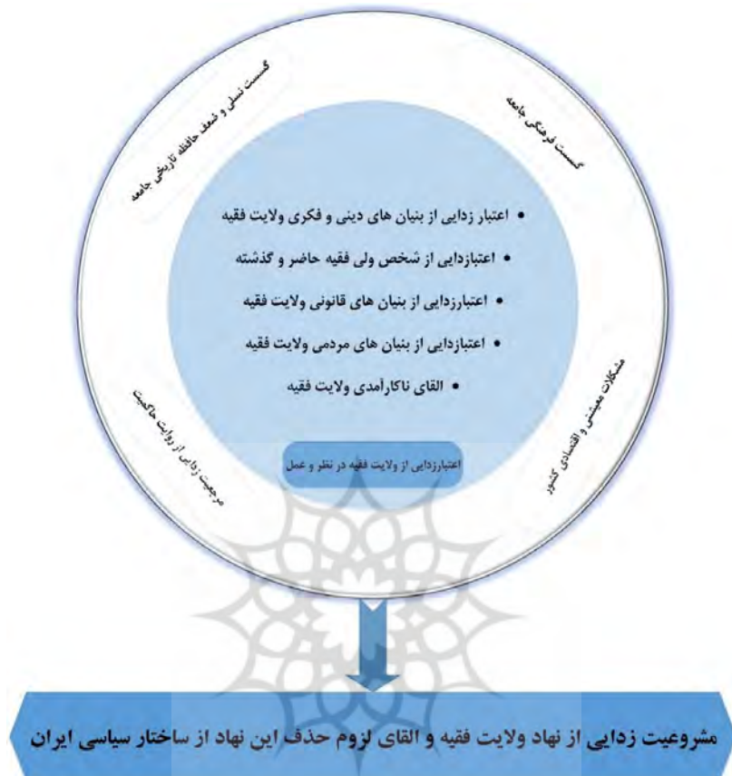
شکل ۲. طرح شماتیک راهبردهای مشروعیت زدایی از ولایت فقیه در رسانه‌های بیگانه فارسی‌زبان

پیشنهاد پژوهش حاضر، برای مقابله با عملیات روانی این رسانه ها در زمینه تصویرسازی از نهاد ولایت فقیه، این است که باید روایت واقعی که تاکنون از سوی نظام جمهوری اسلامی صورت پذیرفته؛ تقویت شده و در ذهن ایرانیان بازسازی آن صورت گیرد. باید توجه داشت که نهاد ولایت فقیه، به عنوان بنیادی ترین رکن سیاسی در جمهوری اسلامی ایران، نیازمند حراست و صیانت ویژه است زیرا بیشترین حمله ها و تخریب ها توسط دشمنان انقلاب اسلامی، به سمت این نهاد هدف گرفته شده است. در این زمینه، نیازمند عزم جدی حاکمیت برای مدیریت تصویر نهاد ولایت فقیه در اذهان مردم هستیم. عزمی که تمامی ارگان ها و دستگاه های مرتبط با این نهاد هستیم. از یک سو حاکمیت باید با به