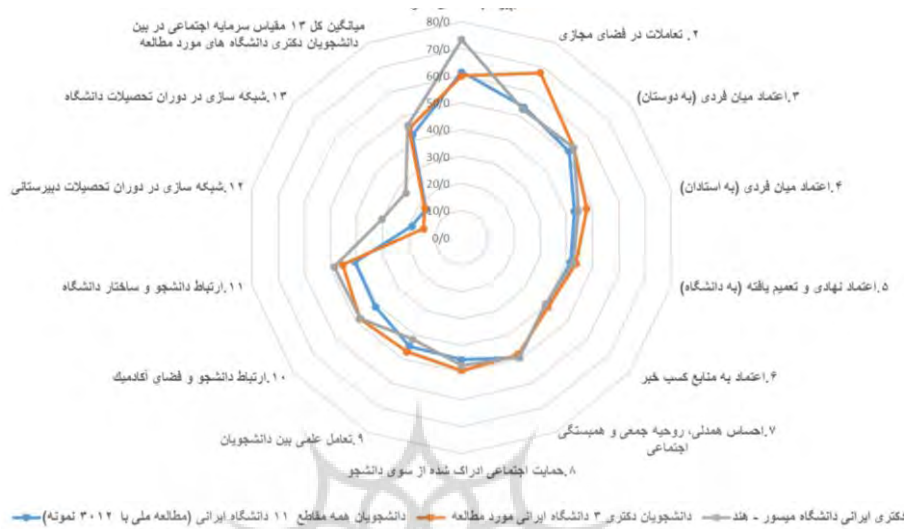
شکل ۳. مقایسه میانگین استاندارد شده مقیاس های سیزده گانه به تفکیک دانشجویان دکتری ایرانی در حال تحصیل در دانشگاه میسور هند و دانشجویان دکتری سه دانشگاه ایرانی و دانشجویان همه مقاطع تحصیلی یازده دانشگاه (نمونه ملی)