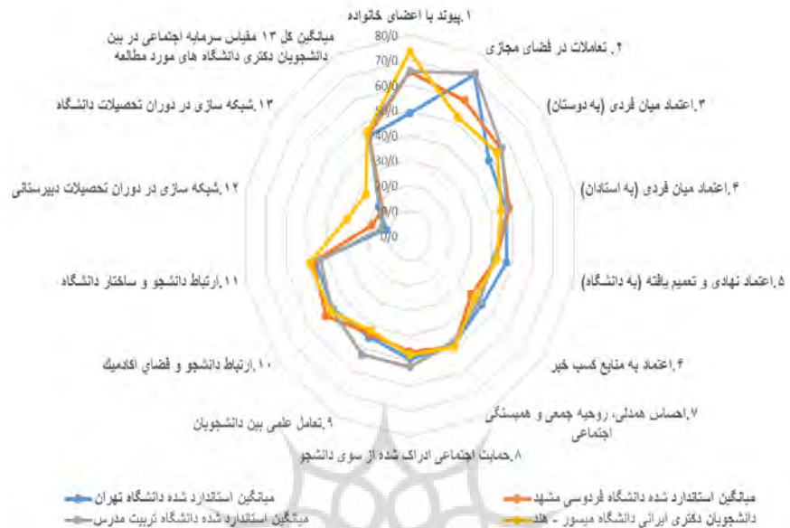
شکل ۲. مقایسه میانگین استاندارد شده مقیاس‌های سیزده‌گانه به تفکیک دانشجویان دکتری در دانشگاه‌های مورد مطالعه

بر اساس شکل ۲، دانشجویان ایرانی مقیم دانشگاه میسور در ارتباط با شاخص‌های سرمایه اجتماعی از دو دانشگاه تهران و فردوسی مشهد در سطح بهتری قرار دارند؛ به طوری که دانشجویان دکتری در حال تحصیل در خارج از کشور در دو شاخص ارتباط با خانواده و شبکه‌سازی در دوره تحصیلات دبیرستانی از میانگین سه دانشگاه ایرانی و همچنین نمونه ملی وضعیت بهتری دارند. هرچند میزان شاخص‌ها بیانگر این است که هر دو گروه دانشجویان ایرانی در حال تحصیل در داخل و خارج از کشور، سرمایه اجتماعی در حد متوسط به پایینی دارند و از این حیث وضعیت آن‌ها تا حدودی مشابه است. با وجود این، دانشجویان دکتری در برخی مؤلفه‌ها نسبت به دانشجویان همه مقاطع تحصیلی (نمونه ملی از یازده دانشگاه) تا حدی وضعیت بهتری دارند.