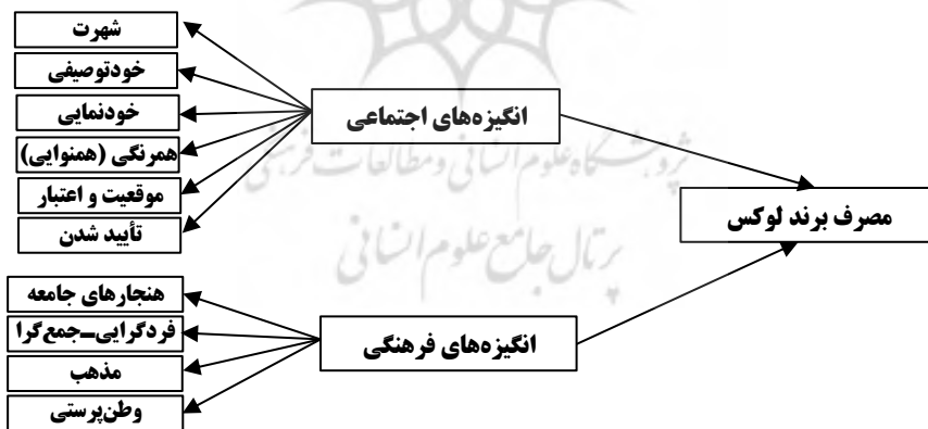
شکل ۱. انگیزه‌های اجتماعی و فرهنگی تأثیرگذار بر مصرف‌برند لوکس در ایران

در واقع، با استفاده از مصاحبه و ادبیات پژوهش، ۱۰ انگیزه در دو مقوله اصلی انگیزه‌های اجتماعی و فرهنگی شناسایی شدند و سرانجام، انگیزه‌های شناسایی شده پس از تعدیل از طریق ادبیات موجود، در قالب شکل ۱ به صورت الگوی مفهومی درآمده‌اند.